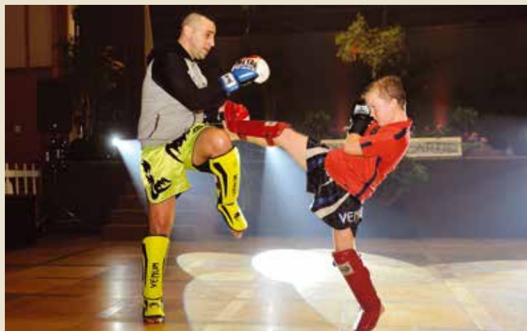
Boxe thaï ou anglaise, kick boxing ou vô thuat, les arts martiaux pratiqués au Fight Club de Chevilly-Larue canalisent les énergies. La boxe se pratique avec rigueur et respect.

Les cours du Fight Club érigent aussi la rigueur comme valeur