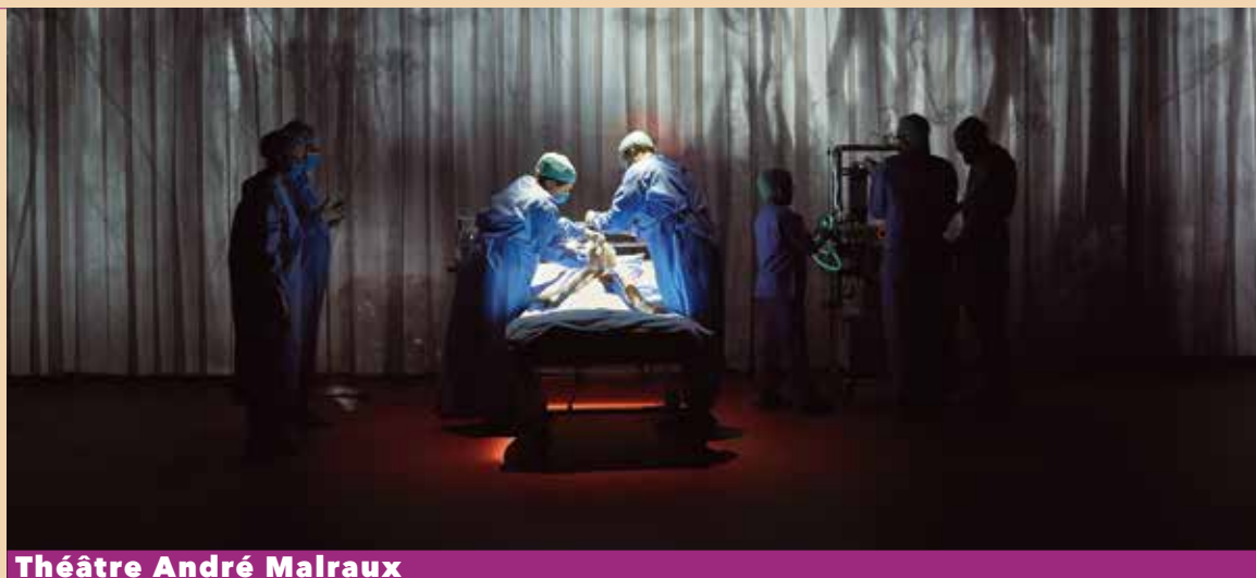
Théâtre André Malraux

Le spectacle Mon cœur de Pauline Bureau, un grand rendez-vous avec l'écriture théâtrale contemporaine.