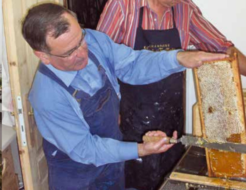
La récolte du miel des ruches de la Ferme du Saut du Loup.