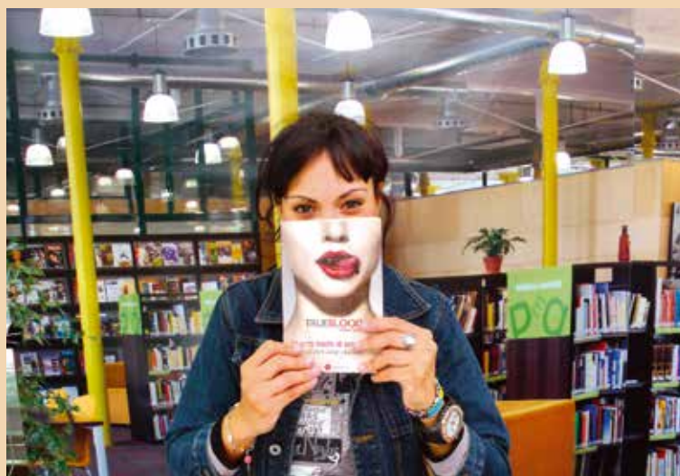
Les ateliers bookface, un moment d'amusement, un résultat surprenant.

La médiathèque Boris Vian fête ses 10 ans en mai ! Pour préparer l'événement, les Chevillais sont invités à participer à des ateliers bookface et des ateliers créatifs.