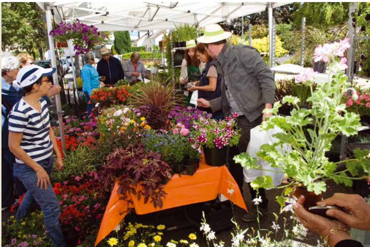
Plantes grasses, aromatiques ou mellifères, fleurs d'ornements... À la Faites du jardinage , les Chevillais trouvent tout ce qu'il faut pour jardiner leur quotidien.

Un budget de 13 500 € est alloué cette année à cette fête. ✨