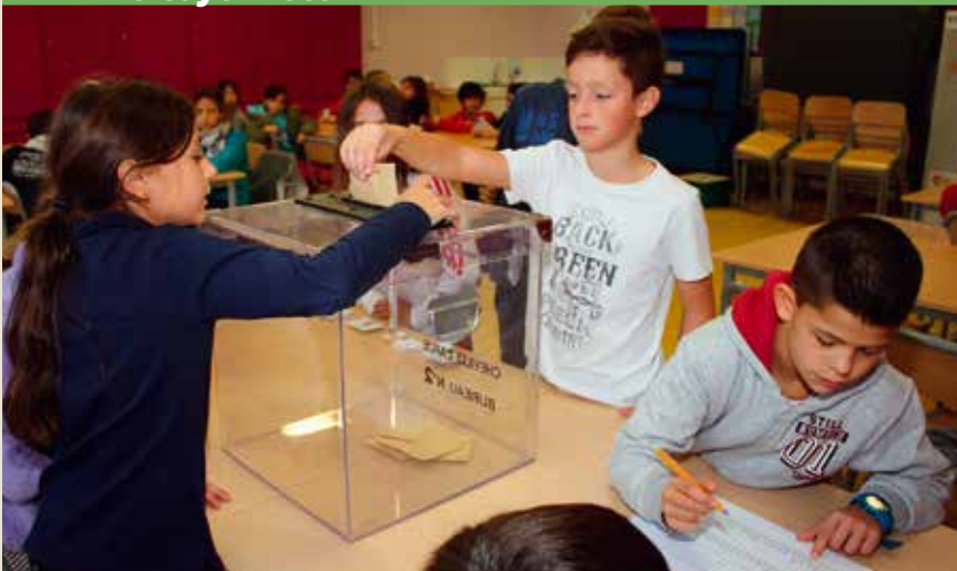
L'élection du Conseil municipal d'enfants, en octobre, est une belle amorce pour aborder la citoyenneté.