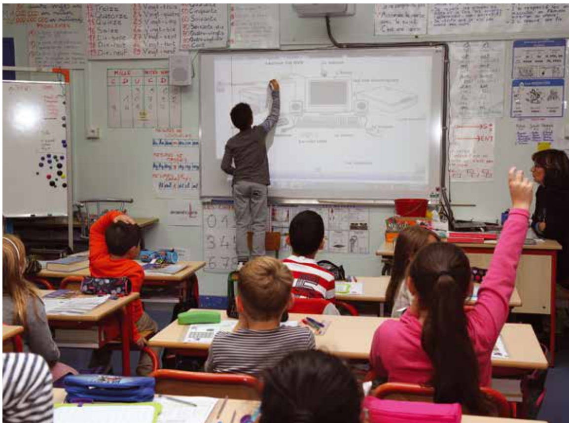
Une classe mobile financée par la Commune –quinze tablettes numériques, un ordinateur et un routeur wifi- a été constituée dans chaque école élémentaire chevillaise.

C'est à l'éducation que la Municipalité accorde à nouveau cette année la priorité : 44% du budget de fonctionnement (soit un peu plus de 15 millions d'€) est consacré à la politique éducative locale. Il s'agira, en 2017, de poursuivre les projets déjà en œuvre. Les temps d'activité périscolaires resteront gratuits et aucune augmentation significative n'est à noter concernant les tarifs de la restauration scolaire. De nouvelles actions seront menées dans le cadre du Projet éducatif local. Les activités périscolaires seront diversifiées. Cette année les travaux d'extension de la capacité d'accueil de l'école Paul Bert maternelle devraient être réalisés. Les dispositifs en faveur de la jeunesse sont aussi maintenus tels que les séjours collégiens, les ateliers de pratique artistique, les chantiers jeunes, les aides à la première installation, au permis de conduire, à la mutuelle étudiante. Le recrutement de deux animateurs de rue a eu lieu en 2016. Du côté de la petite enfance, une nouvelle crèche est en projet (livraison en 2019), l'allocation différentielle pour les parents embauchant une assistante maternelle reste de mise tandis que l'ensemble des actions d'éveil culturel et éducatif dans les structures municipales sont reconduites.