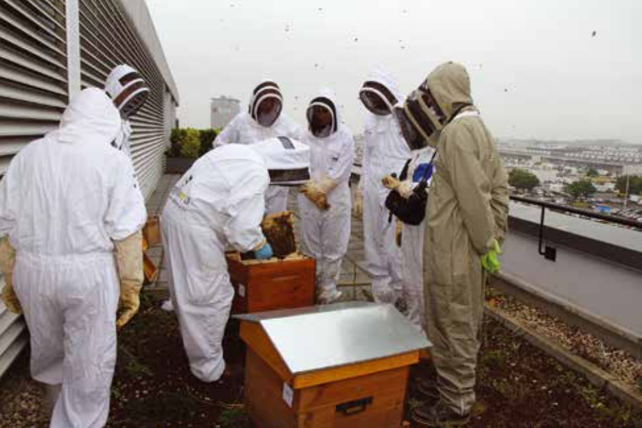
Sur les toits de Vinci, trois ruches ont été installées le 31 mai 2016.