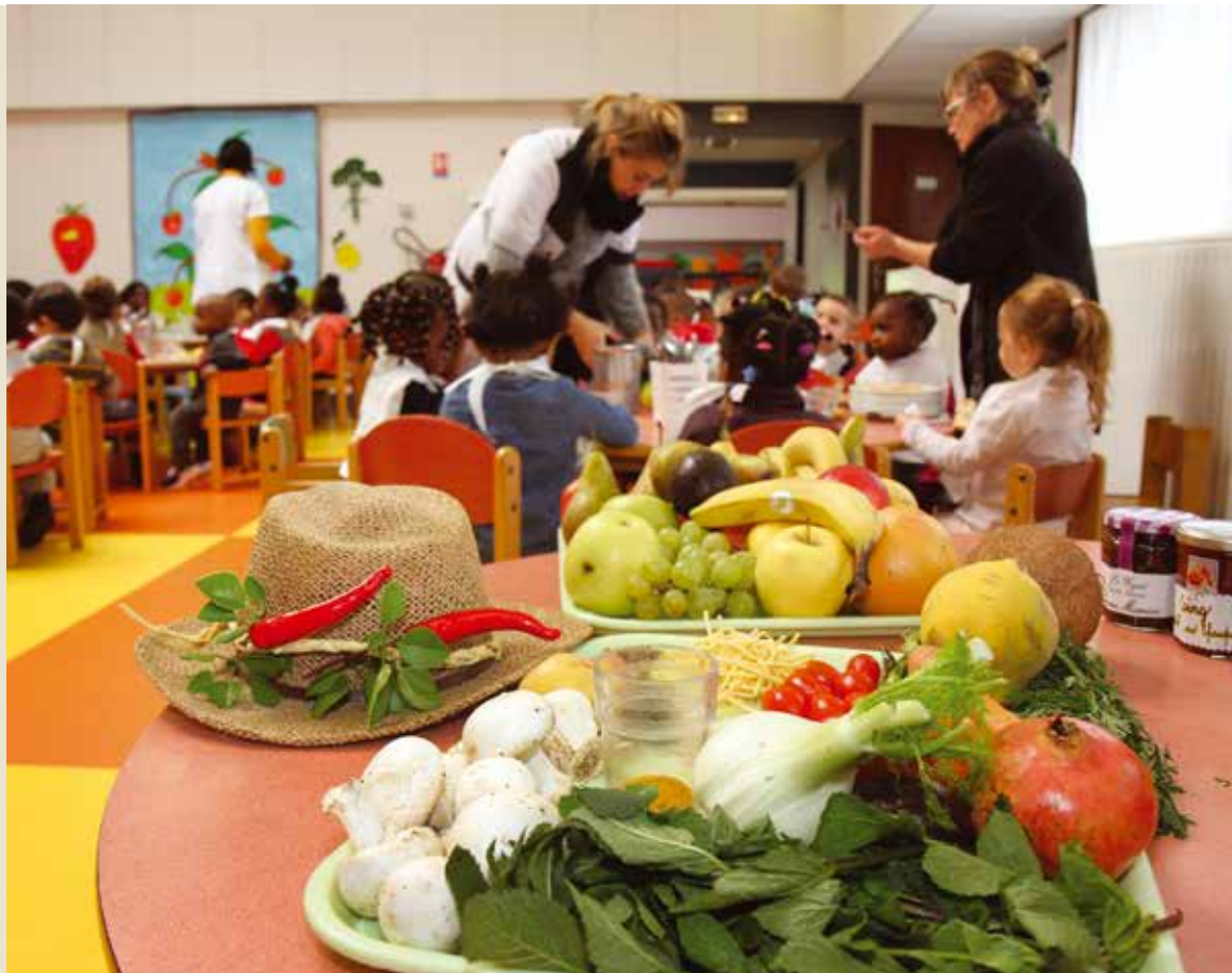
Fruits et légumes bio sont régulièrement au menu des cantines chevillaises.

2 000 repas par jour sont servis dans les cantines des écoles communales chevillaises. Pour faciliter l'accès à ce service, les tarifs sont calculés en fonction du quotient familial. Ainsi, les familles les plus aisées ne paient que 50% du coût réel de ce service, part qui se réduit proportionnellement au revenu de chaque ménage. Si le « tout bio » n'est pas envisageable si l'on veut préserver des tarifs de cantine accessibles, les enfants ont de plus en plus régulièrement des fruits, des légumes et des produits laitiers labellisés bio dans leur assiette. En 2017, la commune lancera un programme renforcé de lutte contre le gaspillage alimentaire qui permettrait de dégager 15 000€. *