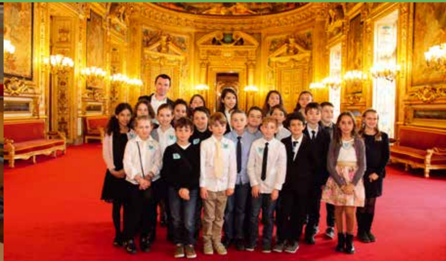
Les enfants de CM2 A de l'école Pasteur dans la salle des conférences du Sénat.

Tandis qu'à l'initiative de la Municipalité les jeunes majeurs ont reçu officiellement leur carte d'électeur lundi 20 mars, ce même jour une classe de CM2 de l'école Pasteur visitait le Sénat. À chaque âge son apprentissage de la citoyenneté.