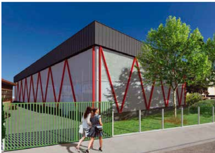
Perspective de ce que sera le gymnase Dericbourg après travaux.

Le gymnase va faire l'objet d'une importante rénovation. Zoom sur un chantier prêt à démarrer.