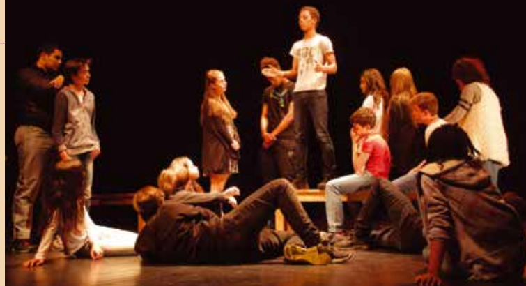
Dans les stages de théâtre côté enfants et ados, la puissance théâtrale tient à l'intensité du jeu des jeunes comédiens.

50 HEURES d'immersion artistique, de foisonnement créatif et de répétitions dans des conditions professionnelles, de travail de scène, de positionnement de la voix et du corps, voilà ce qu'ont vécu les jeunes des stages de théâtre enfants et ados,