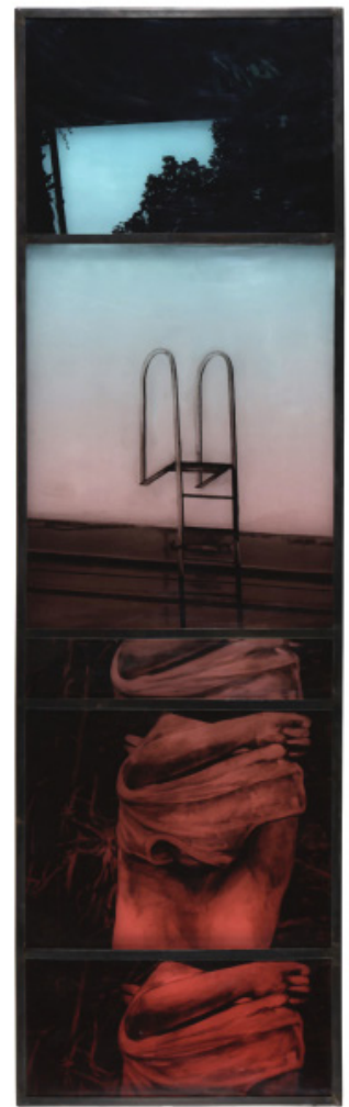
Vertigo 2, 2021

Texte de Thomas Fort - 2021 - «Vertigo» (extrait)