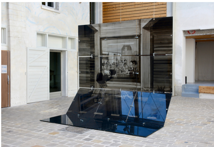
Sans titre, 2017