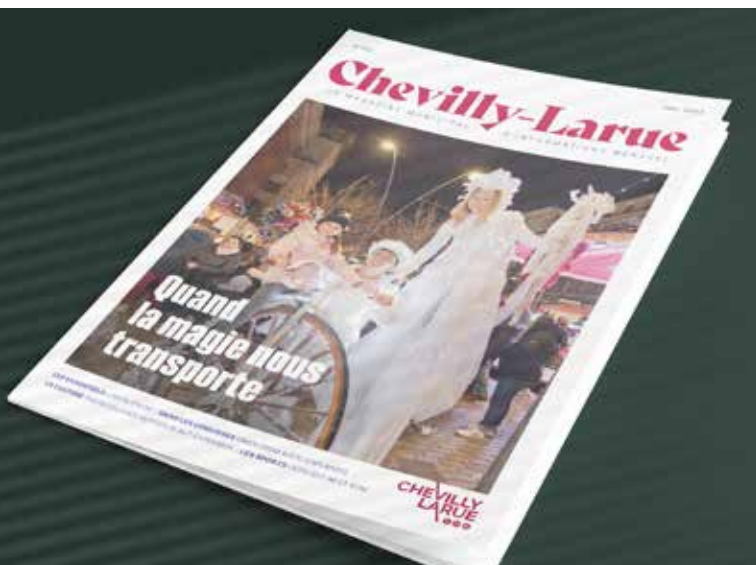
La Une du journal déclinée dans sa future version.

Maquettistes, journalistes, photographes, professionnels de la communication territoriale, tout le monde s'est mis autour de la table pour parvenir au résultat final.