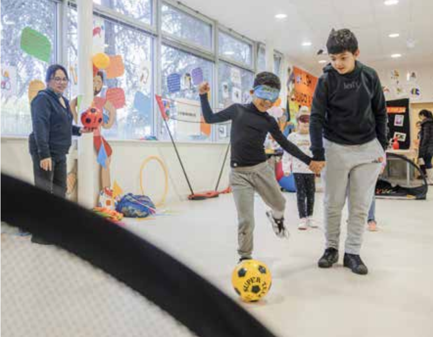
Le handisport était à l'honneur lors de cette journée, avec notamment une activité céci foot. Pas facile de viser les yeux bandés !