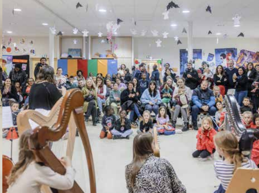
Parents et enfants étaient très nombreux à profiter de concert d'une pause musicale offerte par le conservatoire.