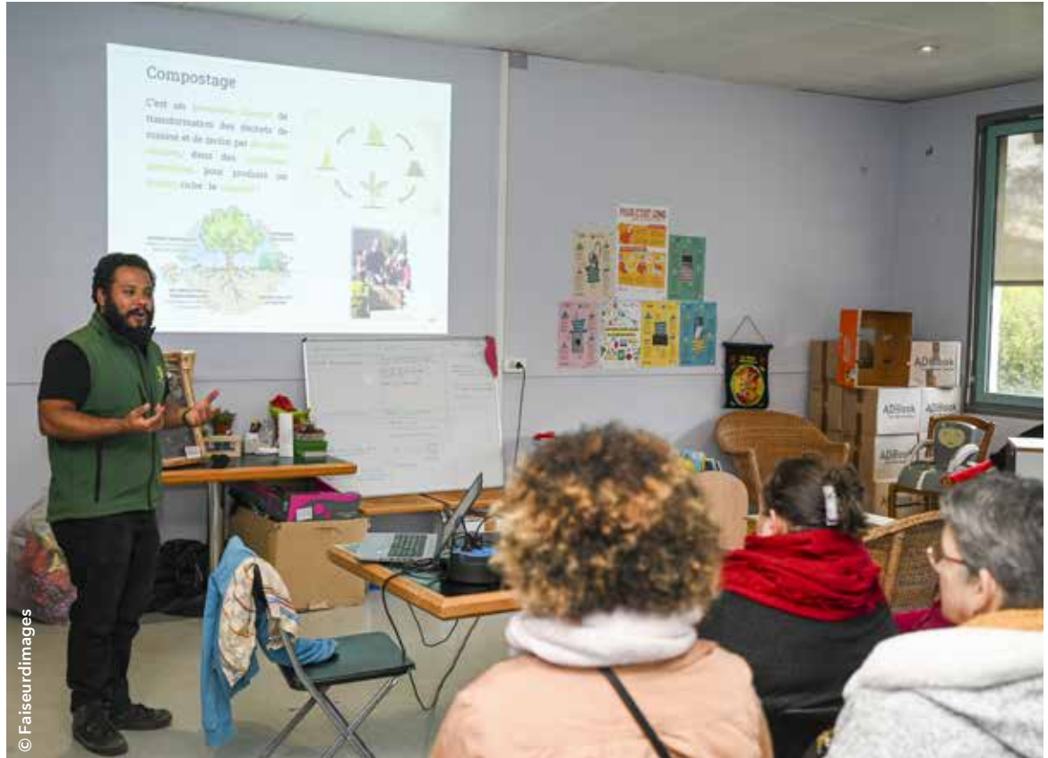
Le compostage était au centre d'un atelier proposé par la ressourcerie dans le cadre de la semaine européenne de réduction des déchets. Les participants ont profité d'une formation et ont pu repartir avec leur composteur.

« le meilleur déchet est celui qu'on ne produit pas ! ». Cela tombe bien : la ressourcerie est l'endroit idéal pour donner une seconde vie aux objets dont on n'a plus l'utilité. Elle a ainsi profité de cette initiative pour présenter ses activités et organiser divers ateliers avec des partenaires. Grâce à la création de cartes de vœux en fleurs séchées avec Créteil Ressourcerie, la création de décorations de Noël en matériaux de récup' et la réparation de vélos avec l'association La recyclette 94, le partage des connaissances et les échanges de savoirs étaient au rendez-vous. Chacun a également pu dialoguer autour du Zero Waste (zéro gâchis) lors d'un débat animé par une intervenante de Zero Waste France. La sensibilisation au compostage était également de la partie avec un atelier de découverte des règles de ce processus. Tout un programme pour favoriser la réduction des déchets et adopter les bons gestes au quotidien.