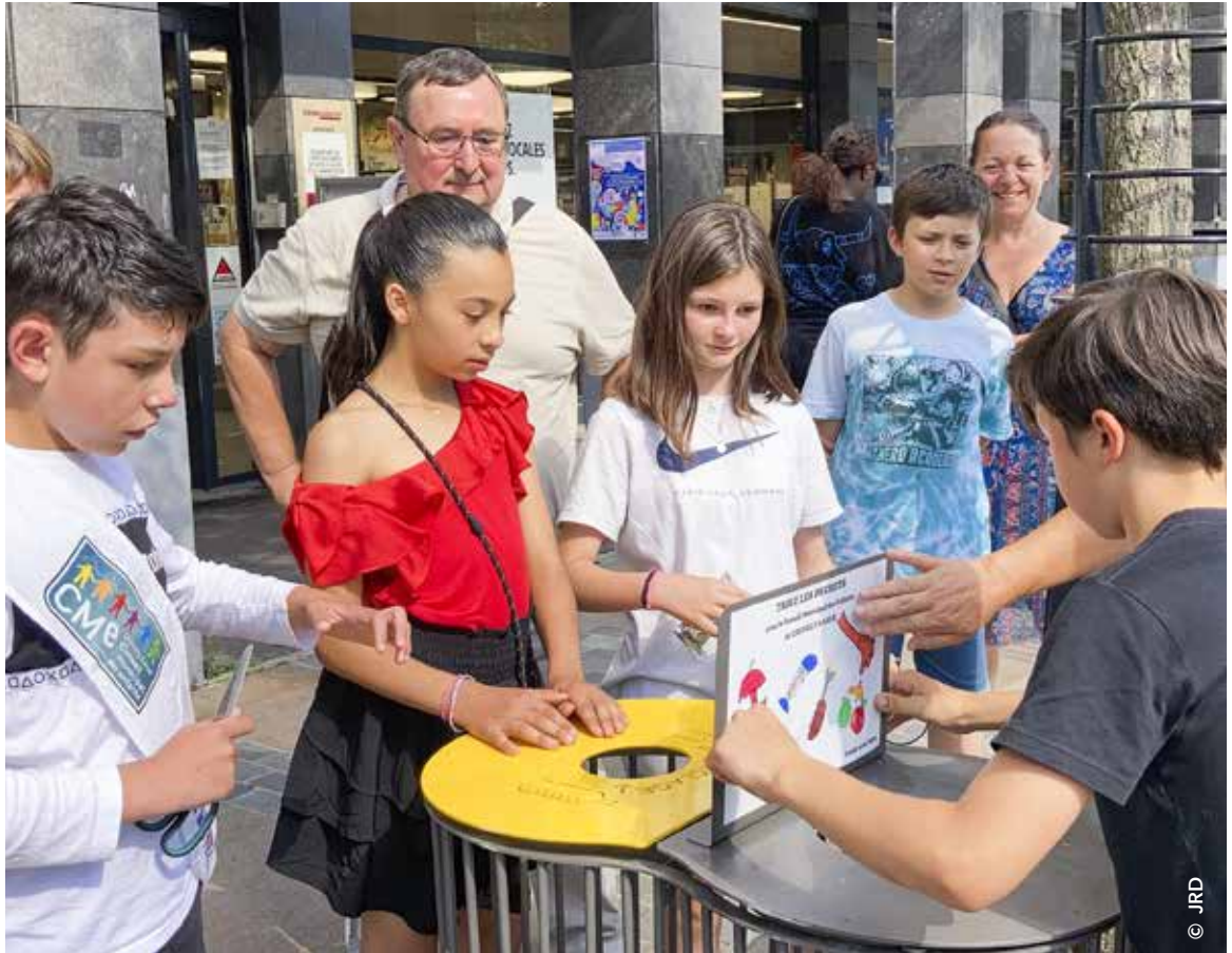
Les jeunes élus du Conseil municipal d'enfants (CME) ont inauguré des poubelles de tri place Nelson Mandela l'an dernier, accompagnés d'élus municipaux et de bénévoles du CME.

La sensibilisation des plus jeunes aux enjeux environnementaux est un point essentiel pour éveiller les citoyens de demain et adresser dès aujourd'hui des messages aux parents dont l'impact sera forcément décuplé. Mais ce sont parfois les enfants qui prennent les devants. Les jeunes élus du CME, conscients de l'importance de trier et recycler les déchets, n'ont attendu personne pour s'approprier le sujet. C'est à leur initiative que des poubelles de tri ont été installées dans l'espace public l'an dernier, notamment sur la place Nelson Mandela. Un dispositif qui favorise ainsi le traitement et la valorisation de tous les déchets recyclables. Très impliqués en faveur de la propreté, ils ont également organisé un nettoyage citoyen réunissant enfants et adultes en juin dernier. Près de 80 kg de déchets ont pu être ramassés. Toute la jeunesse chevillaise s'investit pour avoir un environnement plus agréable. Les enfants des écoles Paul Bert et Salvador Allende ont notamment réalisé des dessins qui ornent les bornes d'apport volontaire enterrées récemment installées dans le quartier Sorbiers-Saussaie. Une manière de s'assurer que le dispositif est bien respecté grâce à leurs œuvres destinées à sensibiliser et à interpeller les plus grands.