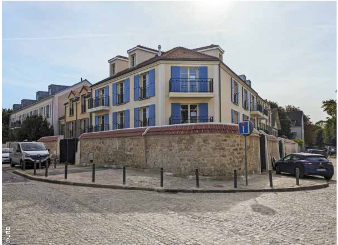
Les récentes constructions rue Outrequin s'intègrent harmonieusement avec l'existant et préservent l'identité du centre historique.

En 2022, plusieurs dizaines de Chevillais ont participé à des ateliers d'élaboration de la charte qualité construction et préservation du cadre de vie. Chacun a ainsi pu faire part des exigences sur la qualité des nouvelles constructions dans la commune. Une démarche volontariste pour inverser la logique : d'abord se mettre d'accord avec les propriétaires et les riverains immédiats sur ce qui est souhaitable et ce qui ne l'est pas en termes de constructions, puis ensuite communiquer ces informations aux promoteurs intéressés. C'est seulement à l'appui de ces informations que des négociations d'acquisition pourront être entamées. L'objectif est ainsi de limiter une trop grande densification des quartiers et une envolée des prix. À l'issue de ce travail, si un projet est jugé acceptable, il devra alors se plier au maximum d'exigences paysagères, environnementales et de qualité de vie indiquées dans la charte.