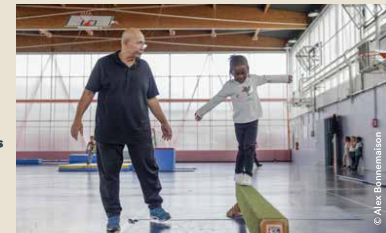
Grâce aux séances d'éveil sportif proposée aux enfants des centres de loisirs, l'équilibre et les fonctions motrices se développent dès le plus jeune âge.

É QUILIBRE sur la poutre, sauts pour travailler la détente verticale, parcours sportif pour développer la mobilité, plusieurs ateliers attendent les jeunes Chevillais en ce mercredi matin. Une dizaine d'enfants, répartis en deux groupes, s'amuse et se dépense au gré des exercices proposés. Les enfants sont guidés par des éducateurs