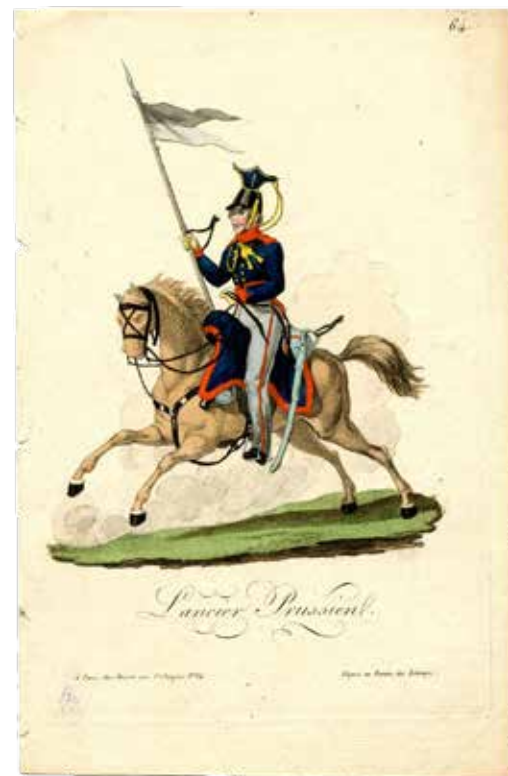
Lancier prussien, gravure de l'époque du Premier Empire, France.