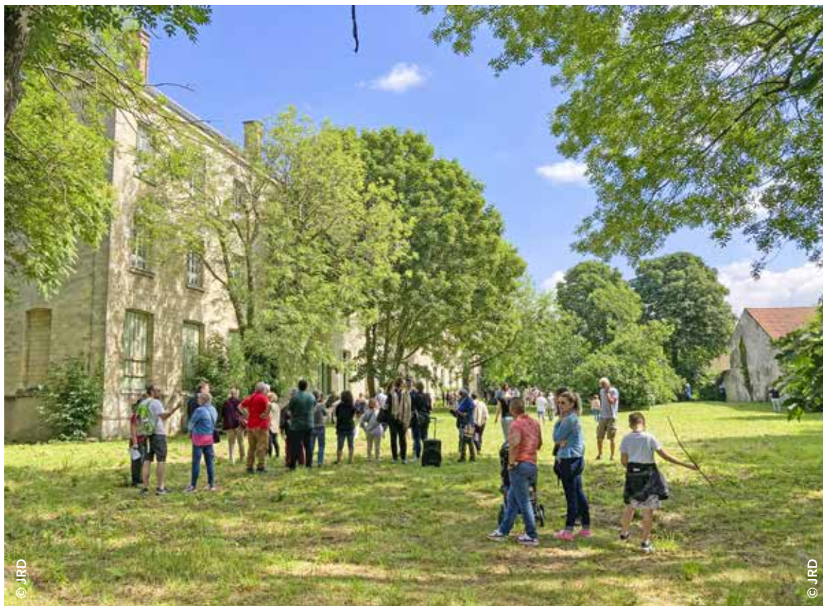
Les Chevillais et les élus municipaux ont pu découvrir le parc du monastère et réfléchir à ses futurs aménagements à l'occasion d'une visite organisée en juin 2022.