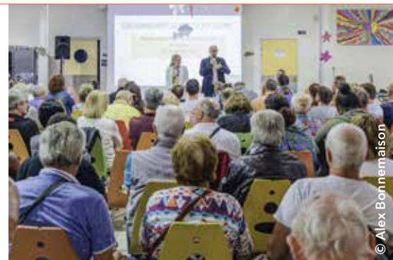
Près de 150 résidents du quartier Bretagne ont participé à la réunion du 2 octobre dernier présentant les conclusions du questionnaire lancé en mai.