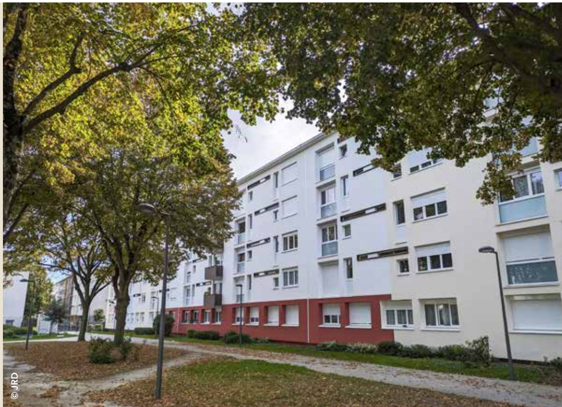
Les bâtiments du quartier Sorbiers-Saussaie ont bénéficié de travaux de rénovation thermique en façade et à l'intérieur des logements afin d'améliorer le confort des habitants et de réduire les déperditions énergétiques.

C'est une grande étape dans l'évolution de la ville : la rénovation urbaine du quartier Sorbiers-Saussaie arrive à son terme. Ce projet a organisé la mue d'un quartier plus ouvert sur la ville, grâce à l'aménagement de la voie Rosa Parks, qui rejoint désormais la place Nelson Mandela, et au percement des longues barres d'habitation qui fermaient les cheminements. Un quartier dont la mixité a été renforcée par la réalisation d'immeubles de copropriété en accession sociale, favorisant les parcours résidentiels des Chevillais. Tous les anciens bâtiments ont également fait peau neuve, offrant non seulement un cadre de vie plus agréable aux Chevillais, mais aussi des logements plus sains et confortables sur le plan thermique. ✨