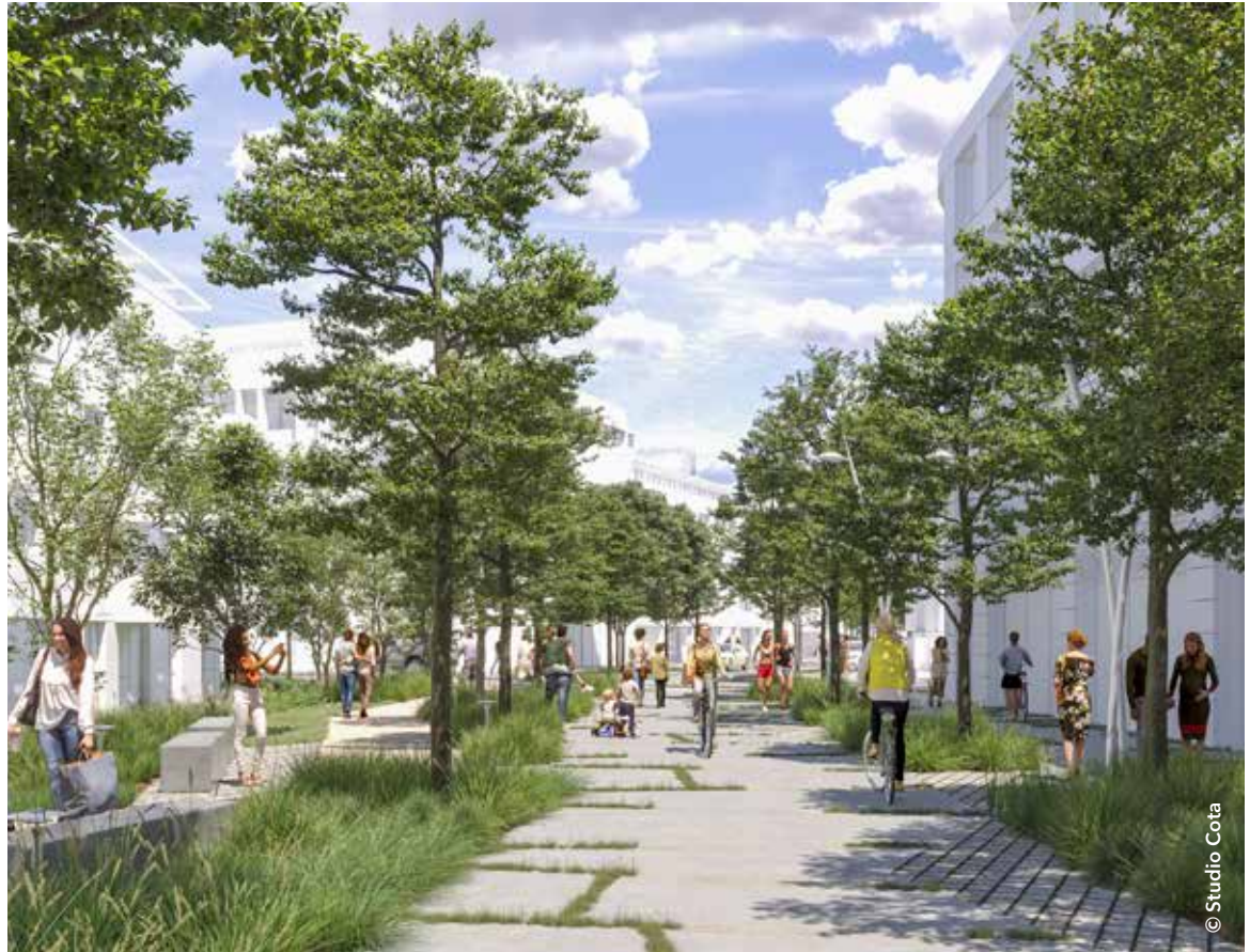
Perspective de la promenade Arthur Rimbaud qui offrira une circulation apaisée au cœur du quartier.