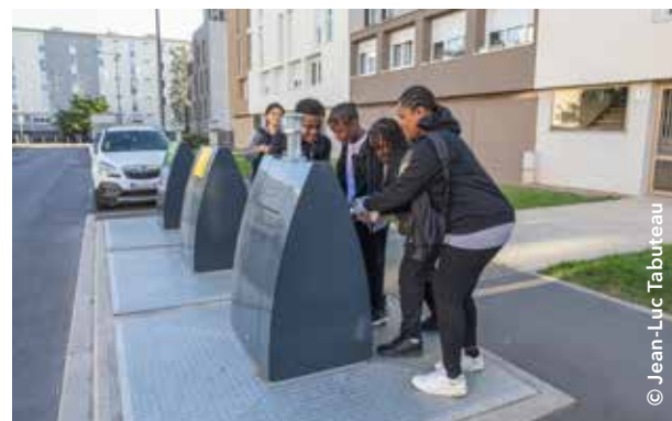
Les nouvelles bornes d'apport volontaire enterrées ont pris place dans l'espace public, comme ici rue de Picardie.