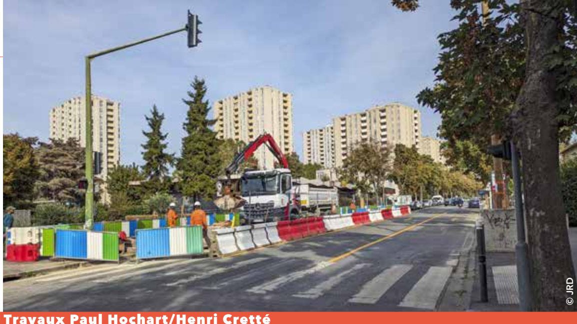
Travaux Paul Hochart/Henri Cretté