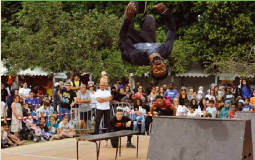
À force d'envolées acrobatiques, les yamakasi ont presque touché les étoiles.