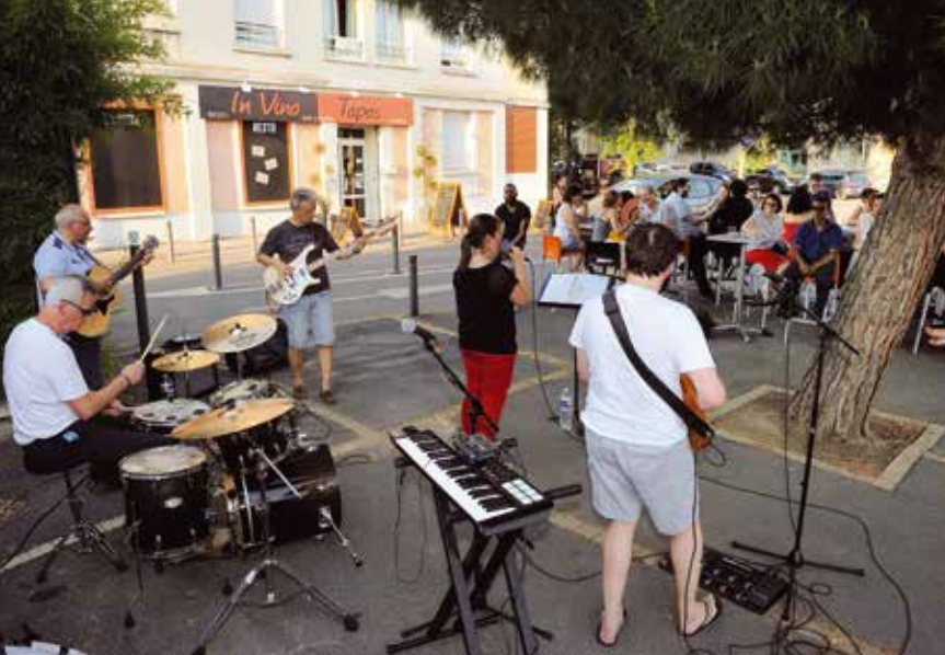
Parvis Léo Ferré, sous les frondaisons l'ambiance était plutôt dépayssante : de la bonne musique et des amis, quoi de mieux ?