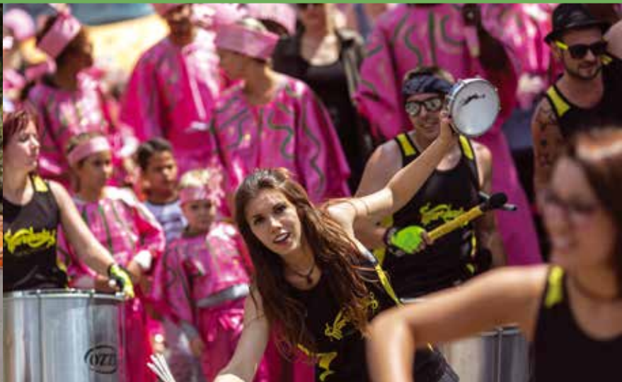
Pendant le défilé du carnaval, battle interstellaire de batucadas entre celle de Chevilly-Larue et celle de Martorell (ville jumelée avec Chevilly-Larue).