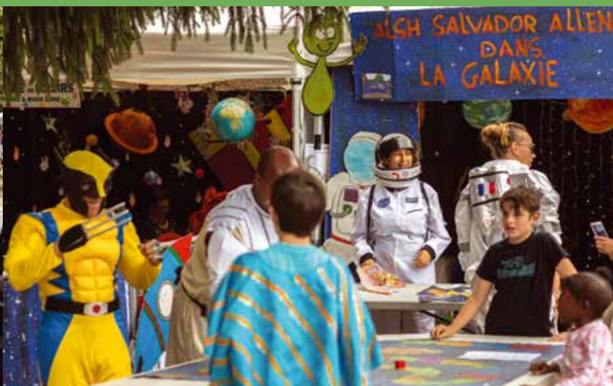
Rencontre du troisième type à la porte des étoiles.