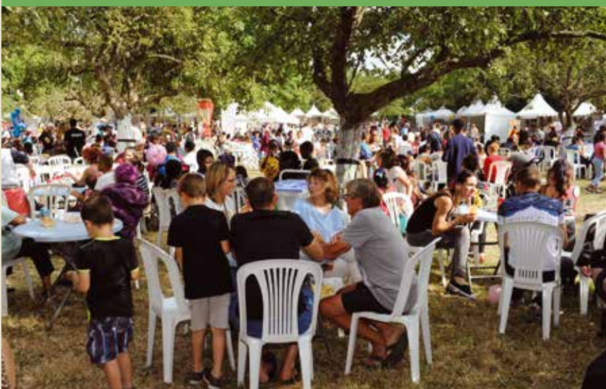
Les constellations de Chevillais dans l'espace restauration.