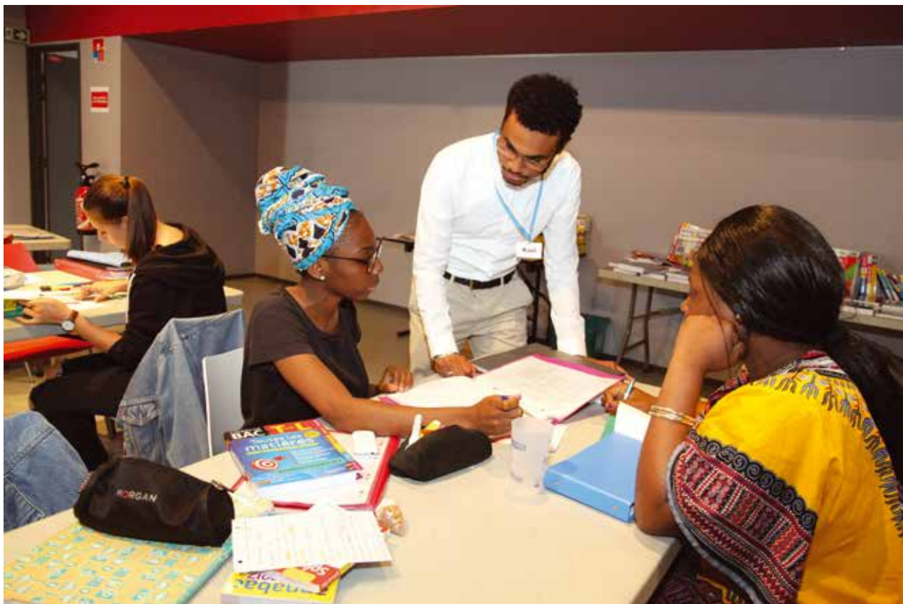
Pendant la quinzaine de révision des examens, des étudiants recrutés par la ville prêtent main forte aux bacheliers. L'occasion pour eux de gagner un salaire qui financera leurs propres projets.

SITE INTERNET : http://missionlocalebvm.fr