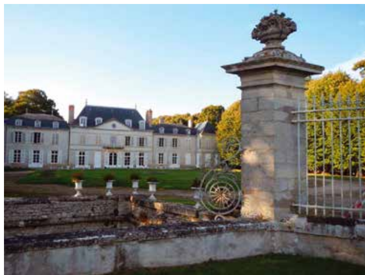
Le château de Chevilly (Loiret).