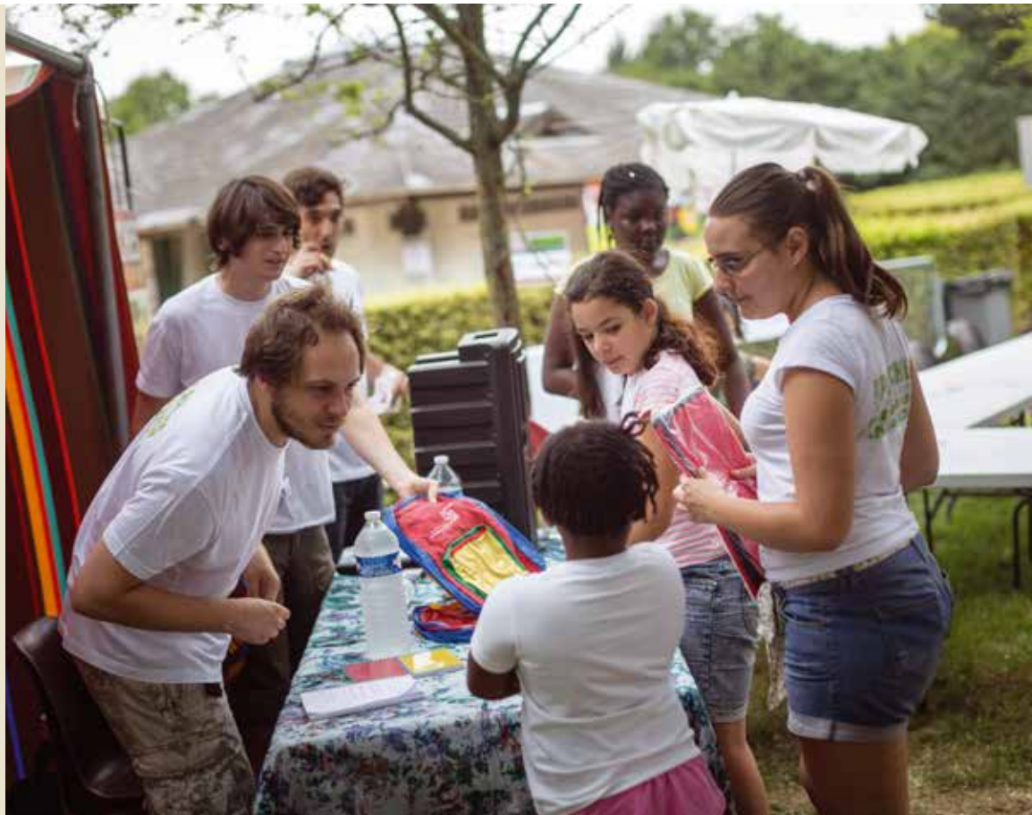
Animateur sur Les Planches, un job d'été qui donne une vraie expérience.

Chaque été, la commune emploie une vingtaine de saisonniers. Des jeunes âgés au minimum de 16 ans qui ont pour tâche de remplacer les agents municipaux partis en vacances. Ils sont affectés à différents services et travaillent pour les espaces verts, la logistique, l'aide à domicile, la propreté de la ville ou l'hygiène des locaux. Quatre animateurs sont également recrutés pour encadrer les animations de l'événement estival "Les Planches". Dans le même temps, le SMJ organise des chantiers d'été avec l'aide des services techniques. Ce dispositif permet à des jeunes d'effectuer des travaux de rénovation dans les équipements municipaux et à la caserne des pompiers. Une première expérience professionnelle en faveur de la collectivité. ✨