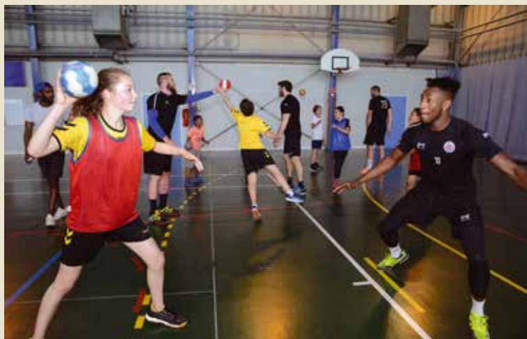
S'entraîner avec les joueurs pro de l'US Ivry, un grand moment pour les U13 de l'Élan.

UNE SÉANCE pas comme les autres. À voir les gabarits des sept joueurs professionnels présents, il y avait en effet de quoi être impressionné. Mais l'ambiance était à la drôlerie : « lors de l'échauffement, on a fait un petit match et les pros se sont vraiment pris au jeu. Ils s'amusaient à porter les enfants jusque dans leur camp. C'était très sympa. En plus, les U11 ont aussi pu y participer »,