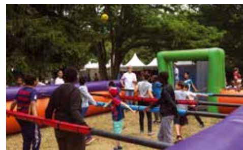
Et si nous n'étions que des joueurs dans le baby-foot géant de l'univers ?

battle entre les deux en fait chalouper plus d'un. « Et en plus ils nous ont mis le soleil ! » renchérit sa copine. Autant dire qu'elles sont dans le thème, puisque la fête communale était placée cette année sous le thème de l'espace. Défilant dans les rues de la ville telle la queue d'une comète, le cortège finit sa course aux étoiles au parc communal, accueilli par des échassiers robots. Place alors aux animations des stands municipaux et associatifs. Ici un atelier astronomie, là une démonstration sportive, là des jeux pour enfants, et là la buvette, ... Un baby-