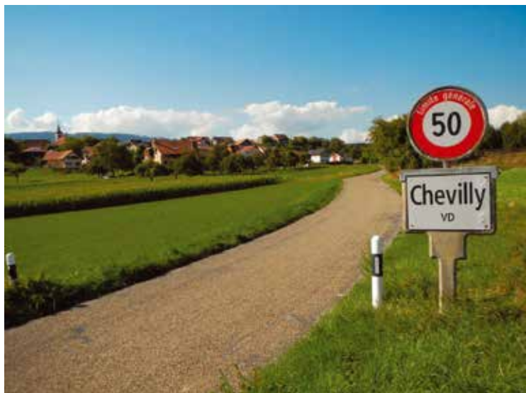
Vue générale du village de Chevilly en Suisse.