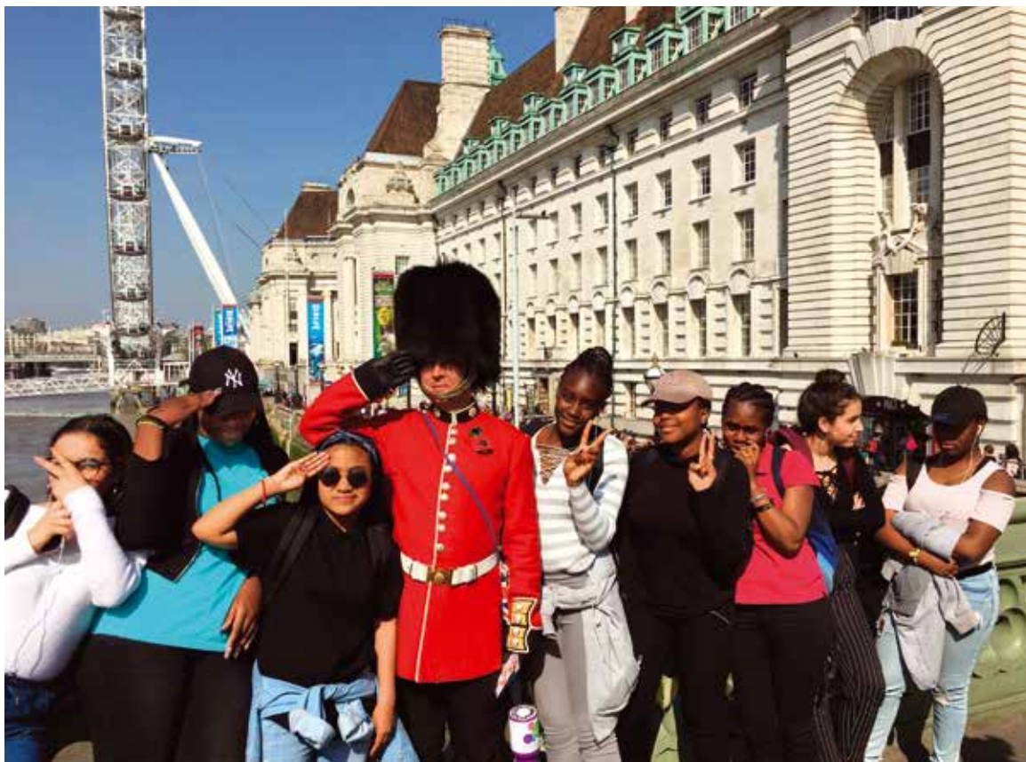
Les huit jeunes filles chevillaises parties à Londres sont bien contentes d'avoir pu, grâce au SMJ, autofinancer leur voyage en tenant la buvette du théâtre André Malraux.