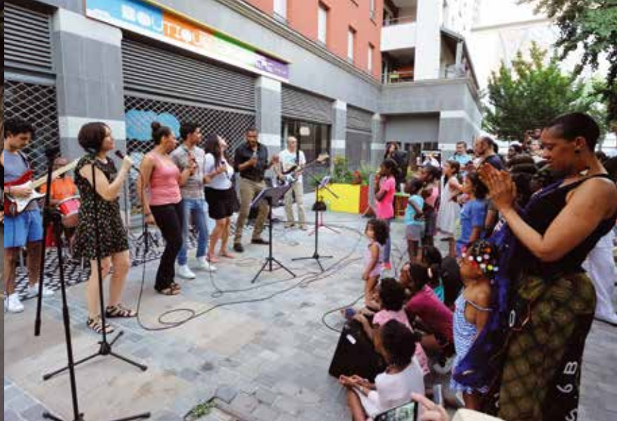
Place Nelson Mandela, la fête de la musique prenait des allures de bal populaire.