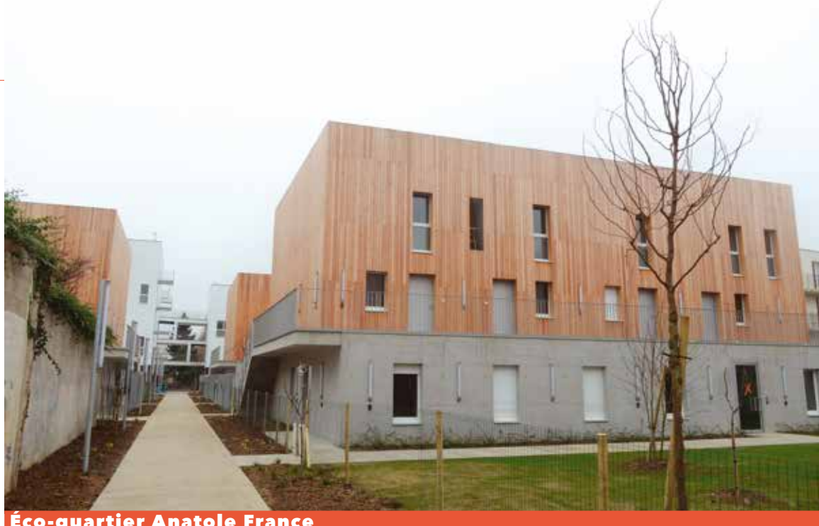
Éco-quartier Anatole France

Les nouveaux immeubles Valophis au cœur du futur éco-quartier Anatole France sont tout juste en train d'accueillir leurs nouveaux locataires, venus de l'ancienne résidence Anatole France.