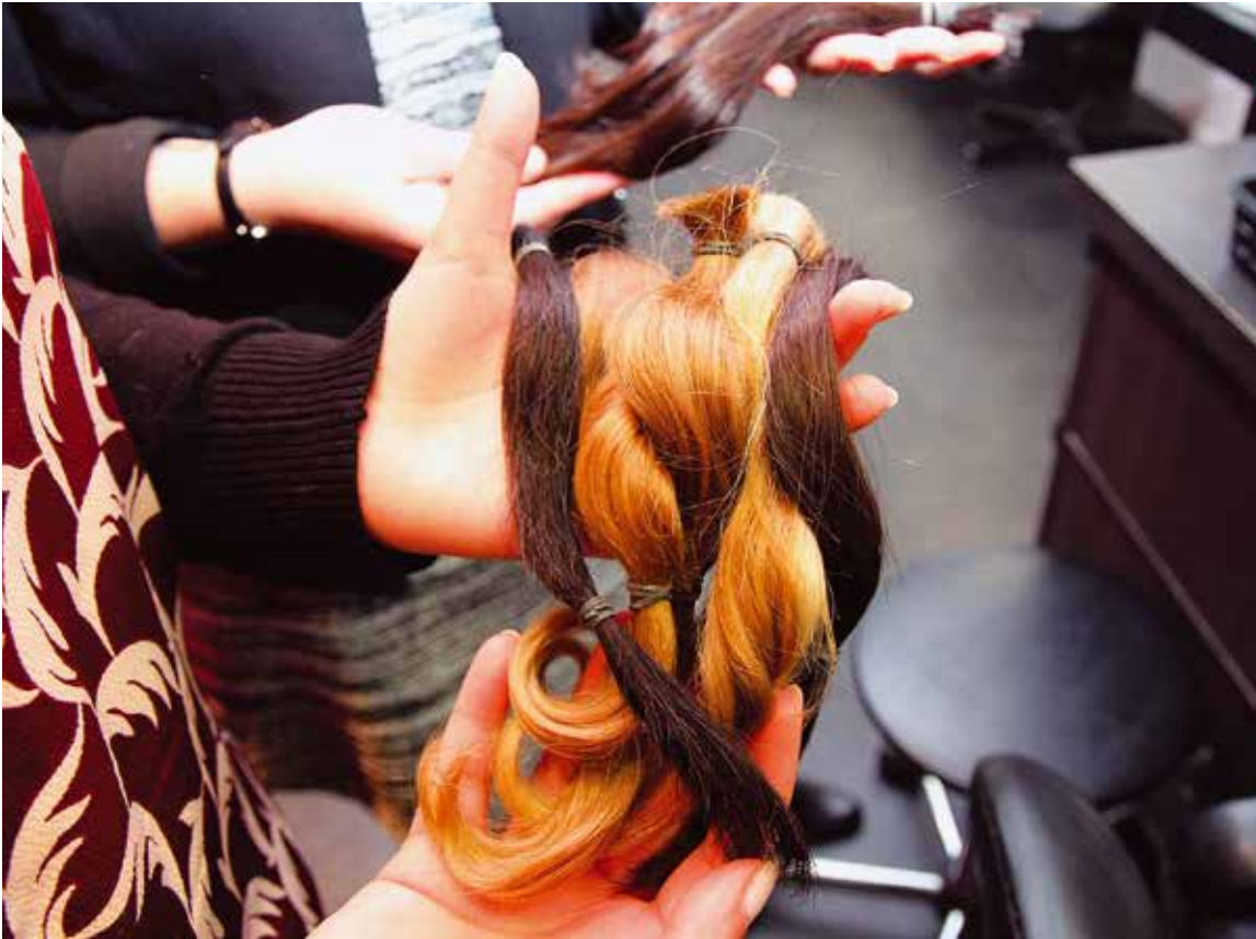
Blondes, brunes et rousses, toutes les belles mèches de cheveux sont les bienvenues chez Fake hair don't care.