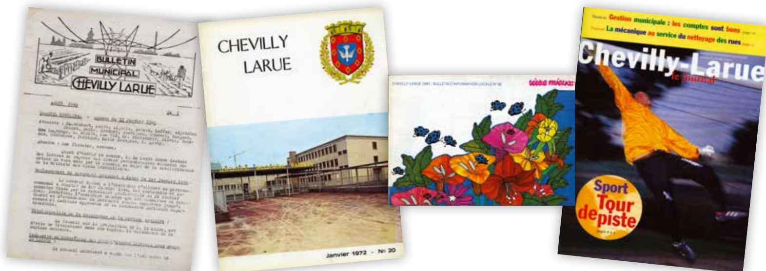
L'évolution du bulletin municipal en magazine au fil du temps vue à travers les Unes : le n°1 de 1949 du « Bulletin municipal de Chevilly-Larue », le n°20 de janvier 1972 de « Chevilly-Larue – bulletin municipal officiel », le n° 36 en 1984 de « Vivre mieux » et le n° 8 d'octobre 2000 de « Chevilly-Larue le journal ».