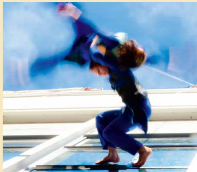
Environnement vertical de la C ie Retouramont : un ballet en suspension dans l'espace urbain.