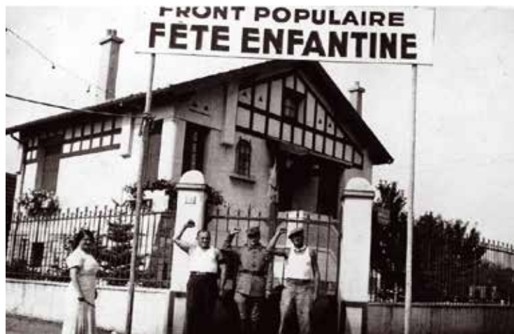
Le Comité du Front populaire annonce par une banderole rue Édison la fête enfantine qu'elle organise le 15 août 1936 dans les lotissements à l'est de la ville. COLLECTION : FAMILLE SAGNAC-KORNBLUM