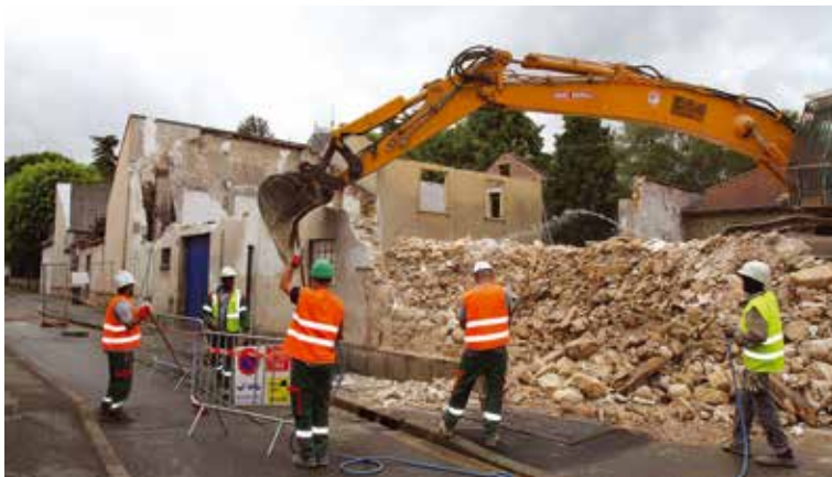
La démolition des bâtiments de la Maison du Conte situés en façade.

Les travaux de réaménagement de la Maison du Conte sont désormais une réalité très concrète : les bâtiments en façade ont été démolis et la reconstruction est en route.