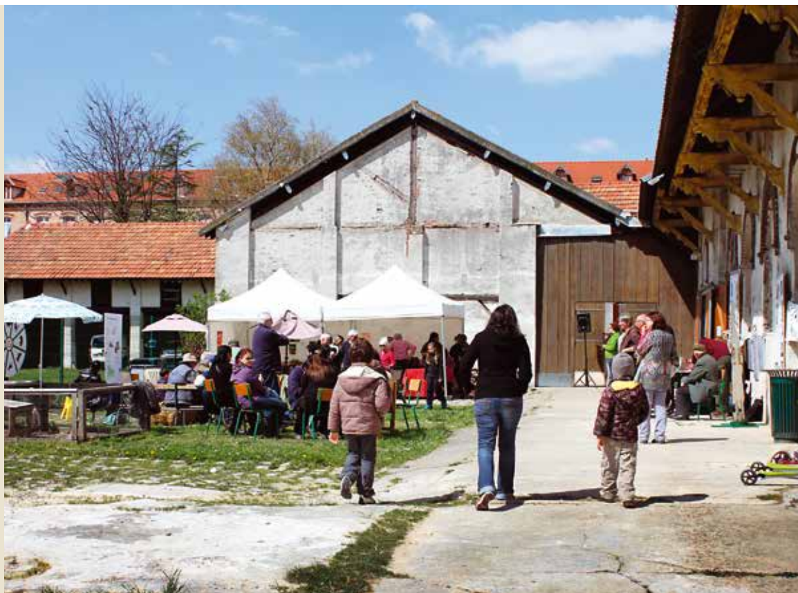
La Ferme du Saut du Loup, un exemple de bâtiment ancien réutilisé à bon escient.

Il y a plusieurs manières de transmettre le patrimoine aux nouvelles générations. On peut le préserver tel quel, en l'entretenant bien sûr, juste pour le rendre visible ou en lui conservant son usage. Par exemple, soucieuse de rappeler le passé de la rue Jules Bohy, ancienne entrée de la briqueterie Bohy, la commune a conservé les pavés d'origine lors de sa réfection fin 2015. On peut aussi le réinvestir en lui donnant une autre fonction. C'est le cas, par exemple, de l'atelier du sculpteur Morice Lipsi, ancienne écurie devenue une partie de la Maison du Conte (encore conservée), ou encore d'une ancienne bergerie devenue la Maison des arts plastiques. ✨