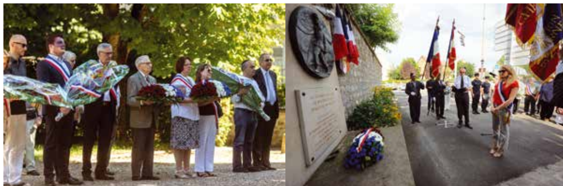
Hommage aux victimes de la Rafle du Vel d'Hiv (photo de gauche) et commémoration de la Libération de Paris (photo de droite)

Le 74 e anniversaire de la Rafle du Vel d'Hiv a été commémoré le 17 juillet en présence d'élus de la Municipalité et de représentants de la communauté israélienne de Chevilly-Larue : la mémoire des 13 152 juifs arrêtés et déportés lors de la Rafle du Vel d'Hiv du 16 juillet 1942 a été honorée ce jour-là. Nora Lamraoui-Boudon, 1 ère maire-adjointe, a fait siens les mots de l'historienne