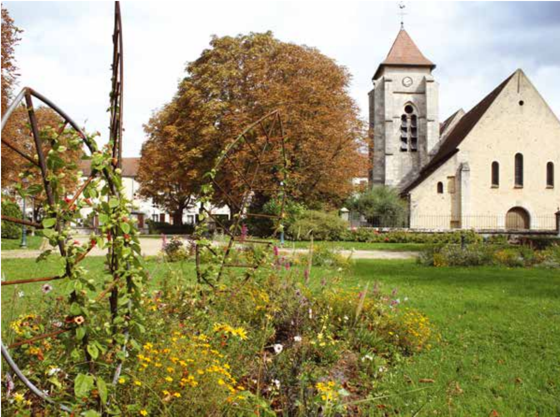
L'église Sainte-Colombe édifice du X e et XV e siècle