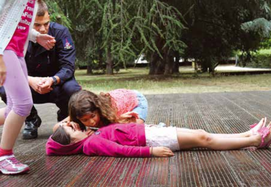
Les enfants aussi peuvent apprendre les gestes qui sauvent : ci-dessus, une petite chevillaise écoute la respiration de son amie.