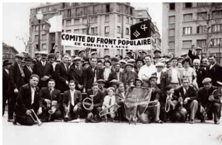
Le Comité du Front populaire de Chevilly-Larue lors d'une manifestation à Paris avec la société de bigophones « Les Joyeux garçons de Chevilly-Larue » fondée en juin 1936.