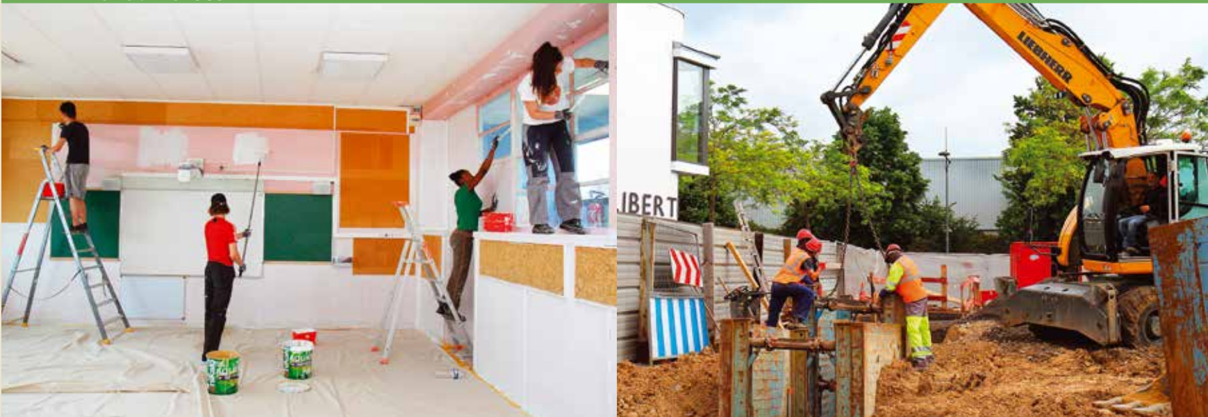
Un chantier d'été à l'école Pierre et Marie Curie (à gauche) et la réfection des réseaux enterrés dans la rue de Verdun (à droite).

Les agents municipaux ont mis à profit la saison estivale pour effectuer ou faire faire de nombreux travaux de voirie ou dans les bâtiments communaux. Les jeunes des chantiers d'été ont également contribué à ces travaux.