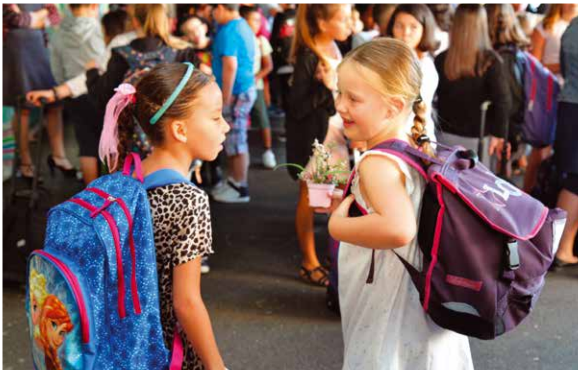
La rentrée, à l'heure des retrouvailles ...