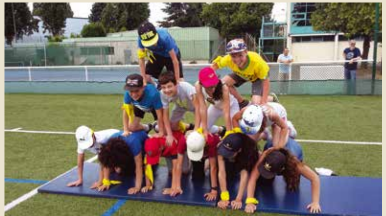
Le stage multisports, que du bonheur !

D U SPORT mais surtout du fun ! 39 jeunes de 11 à 17 ans se sont régalés des activités proposées par le Service municipal de la Jeunesse, l'Élan et le service des Sports. Des originaux bubble foot, jukeball et frisbee aux plus classiques tennis, judo, basket, volley, hand, athlétisme, en passant par le hip-hop, il y en avait pour tous les goûts. « On a terminé la semaine à la piscine avec une matinée de temps libre où on a vraiment laissé les enfants mener les activités », poursuit Christelle, éducatrice. « L'après-midi, c'était Koh-