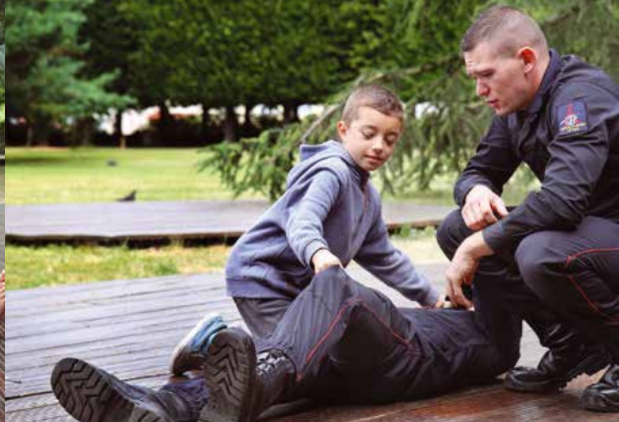
Un jeune chevillais découvre comment installer une victime en position latérale de sécurité.