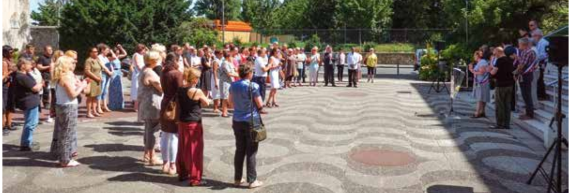
Hommage aux victimes de l'attentat de Nice, place Jean-Paul Sartre le 18 juillet dernier.

Les attentats perpétrés le 14 juillet dernier à Nice et le 26 juillet en l'église de Saint-Étienne-du-Rouvray ont bouleversé la France cet été et renouvellent la nécessité de promouvoir la culture de paix.