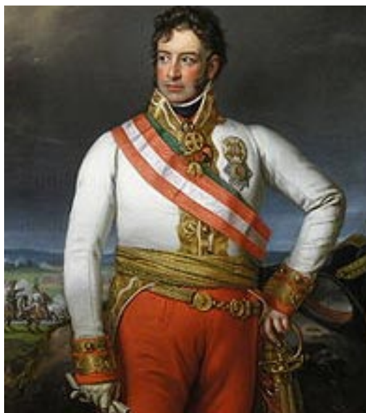
Le prince Charles Philippe de Schwarzenberg (Karl Philipp fürst zu Schwarzenberg) - 1771-1820.