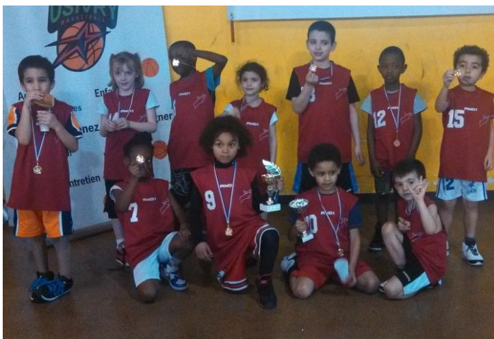
Graines de champions : l'équipe Baby's (5-7 ans) a remporté le tournoi des Fèves à Ivry.

La section basketball de l'Élan ouvre ses portes aux enfants dès l'âge de 5 ans à l'école de basket. Un projet qui plaît beaucoup aux jeunes dont les équipes n'ont pas traîné à briller en compétitions.