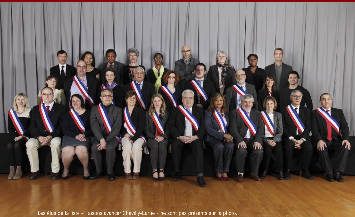
Les élus de la liste « Faisons avancer Chevilly-Larue » ne sont pas présents sur la photo.