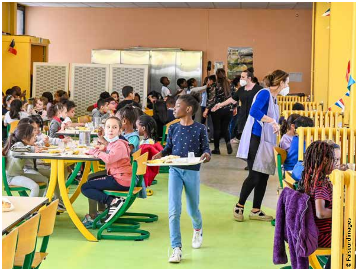
La restauration scolaire bénéficie à nombre de familles. Ces dernières paient le repas entre 0,49 € et 3,39 € selon leur quotient.

Malgré l'augmentation des tarifs municipaux de 1%, Chevilly-Larue continue de proposer à sa population des services très peu chers. Pour s'en rendre compte, une petite étude comparative s'impose. Le prix d'un repas à la restauration scolaire pour les familles au quotient le plus bas s'élève à 0,49€. Dans certaines villes limitrophes, le service similaire est quant à lui facturé entre 0,81€ et 1,25€. Ces chiffres illustrent les efforts consentis par la Municipalité alors que le prix de revient d'un repas était de 10,48€ l'année dernière. De manière générale, la part du coût total du service payé par l'utilisateur (également appelé taux de couverture) est très faible à Chevilly-Larue. Ce taux s'élève par exemple à 6% pour les inscriptions à la Maison des arts plastiques Rosa Bonheur, les 94% restants étant pris en charge par la commune. Les familles inscrites en classe cirque couvrent quant à elles 23% du prix. Quant à la restauration municipale, son taux de couverture est de 18%. Là encore, la part restante revient à la Municipalité. La politique ambitieuse de cette dernière en faveur du pouvoir d'achat est donc une réalité concrète et tangible pour l'ensemble des Chevillais, quels que soient leurs revenus.