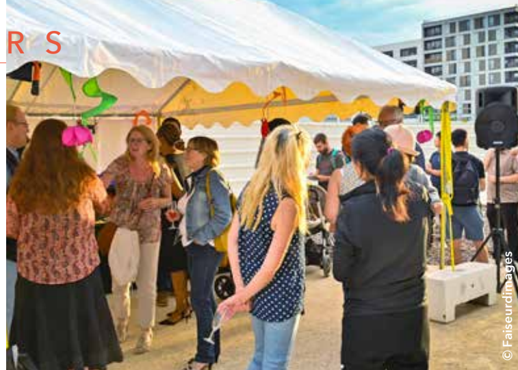
Un sympathique pot d'accueil était réservé aux nouveaux habitants du Triangle des Meuniers.