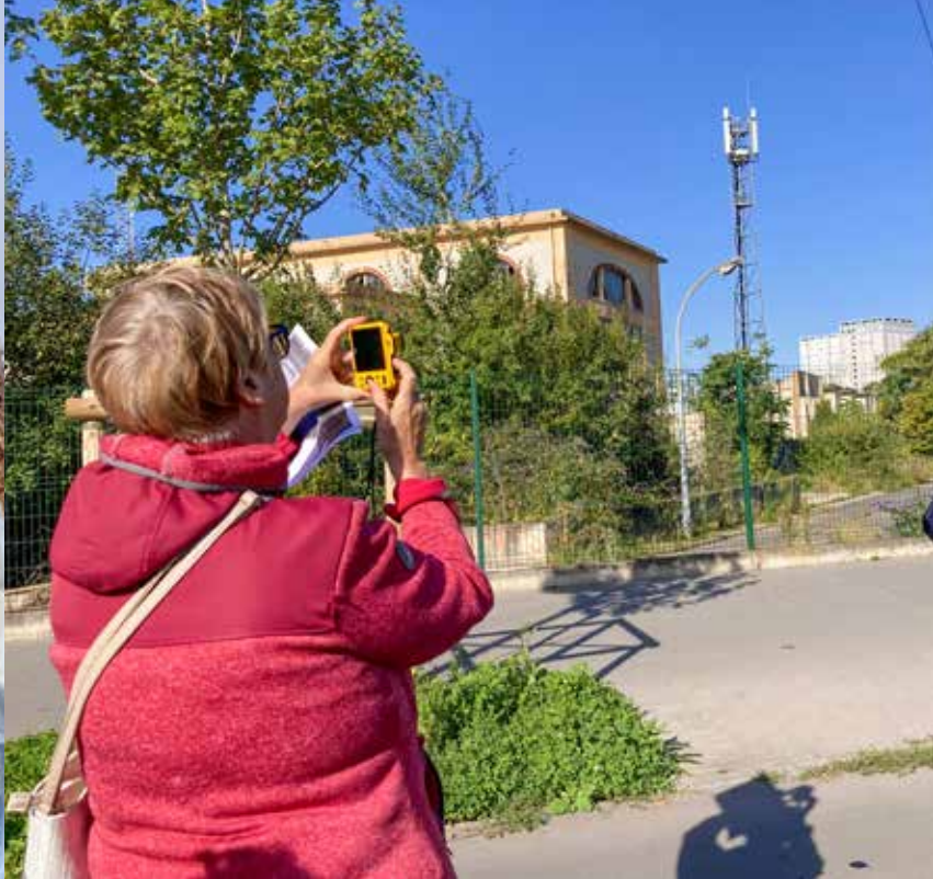
La balade photographique était l'occasion de voir la ville autrement.