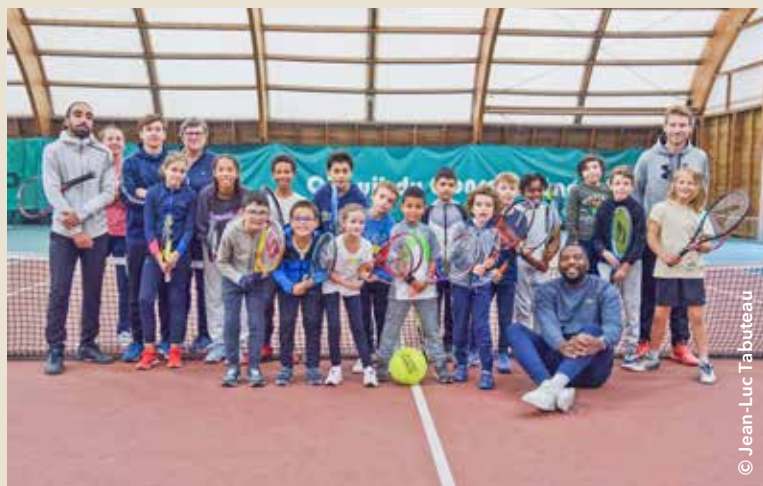
Dotée d'un nouveau bureau et d'une équipe d'encadrants diplômés, la section tennis forme avec passion la nouvelle génération.

A PEINE LANCÉE, cette saison 2022/2023 s'apparente à un coup gagnant pour la section tennis. Entre l'élection d'un nouveau bureau, l'arrivée d'un éducateur diplômé supplémentaire et l'inscription de nouveaux adhérents, le rebond est assuré. La section continue d'accompagner et de former de nombreux joueurs. Elle compte aussi poursuivre son développement en menant à bien divers projets. « Nous souhaitons notamment fidéliser nos adhérents grâce à la