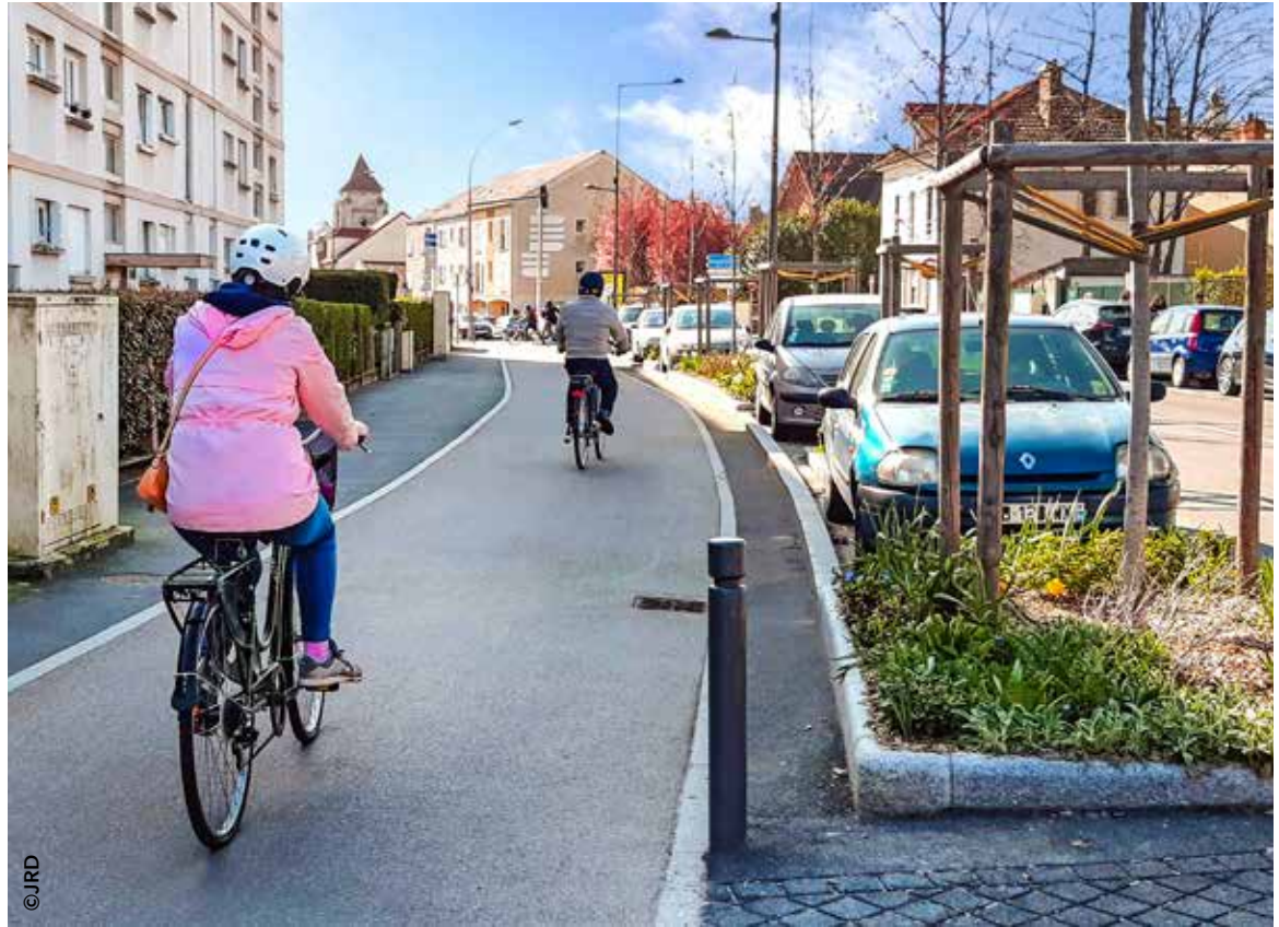
Les Chevillais peuvent bénéficier de l'aide vélo accordée par la Municipalité.

Le Conseil départemental a mis fin aux chèques solidarités qui étaient attribués à environ 75 000 foyers val-de-marnais. Il a en effet pris la décision de consacrer son budget solidarité au versement d'un chèque énergie de 50 € à 50 000 foyers à faibles revenus mais ne bénéficiant pas de l'aide énergie accordée par l'État. Cette mesure, qui laisse de côté 25 000 foyers, s'accompagne par ailleurs de la suppression de la Fête des solidarités, ce rendez-vous convivial qui réunissait les Chevillais et le tissu associatif au gymnase Marcel Paul au mois de décembre.