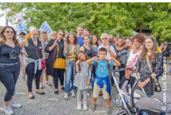
Parents d'élèves chevillais et élus municipaux étaient présents lors de la mobilisation organisée par la FCPE 94 à Vitry-sur-Seine le 2 septembre dernier.