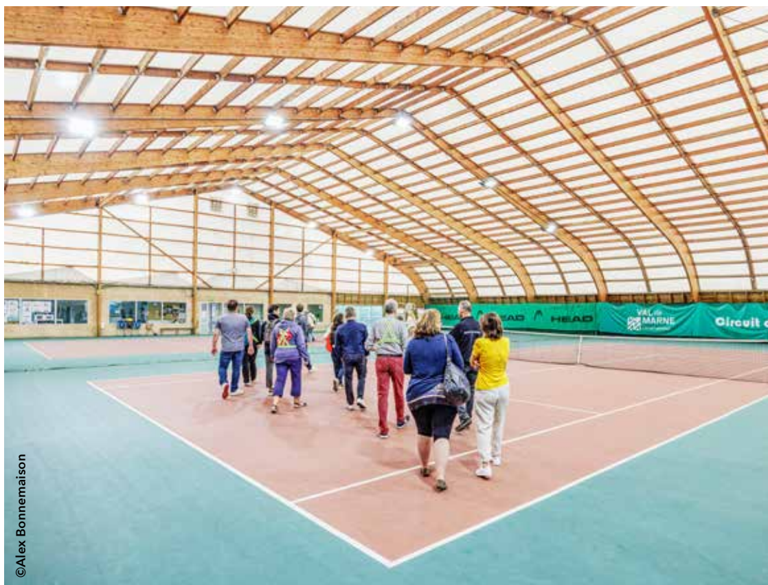
90% des luminaires du parc des sports, dont les éclairages des courts de tennis, ont été remplacés par des LED. Un investissement qui permet une réduction de 50% sur la facture énergétique.