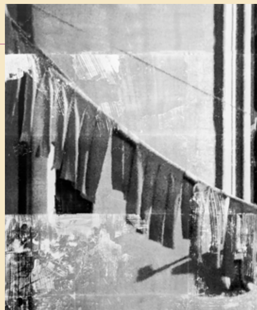
L'exposition L'image d'un monde sensible suggère combien les images peuvent être trompeuses...

les images mentales d'Aurore Pallet travaillées à partir de photos sérigraphiées sur des bâches suspendues, le trompe-l'œil lumineux de Lenny Rébéré et les formats plus classiques de Timothée Schelstraete, les trois artistes s'appuient sur l'architecture de la Maison de Rosa Bonheur. Plusieurs pièces ont été produites spécialement pour l'exposition, voire créées sur place pour certaines. « C'est une aide à la production, une forme de carte blanche pour permettre aux artistes de tester de nouvelles choses ». Quoique différentes, ces trois démarches artistiques