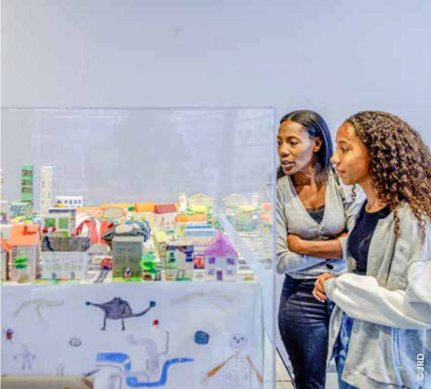
Lors des journées du patrimoine, les visiteurs ont pu découvrir la maquette de la ville réalisée par les enfants de l'école élémentaire Pasteur.