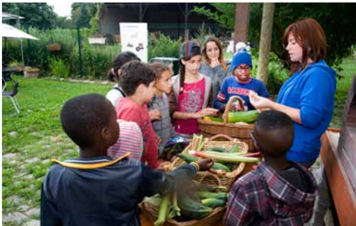
Les activités d'été sont le fruit de l'implication des services municipaux mais aussi des partenaires, comme La Ferme du Saut du Loup.