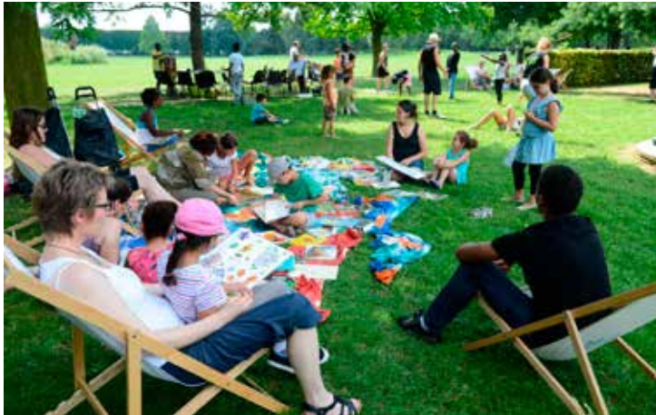
Sur Les Planches, les transats sont installés tous les jours. Idéal pour écouter les histoires les pieds dans l'herbe de la médiathèque.