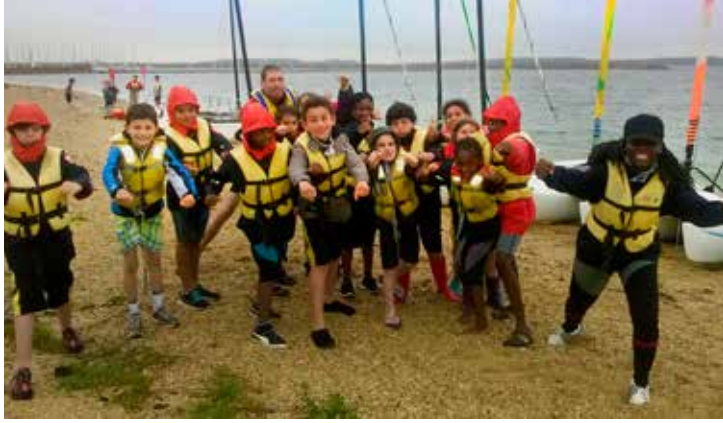
Les séjours et mini-séjours font toujours le bonheur des enfants, comme ici à Bar-sur-Seine (dans l'Aube) en juillet de l'année dernière.