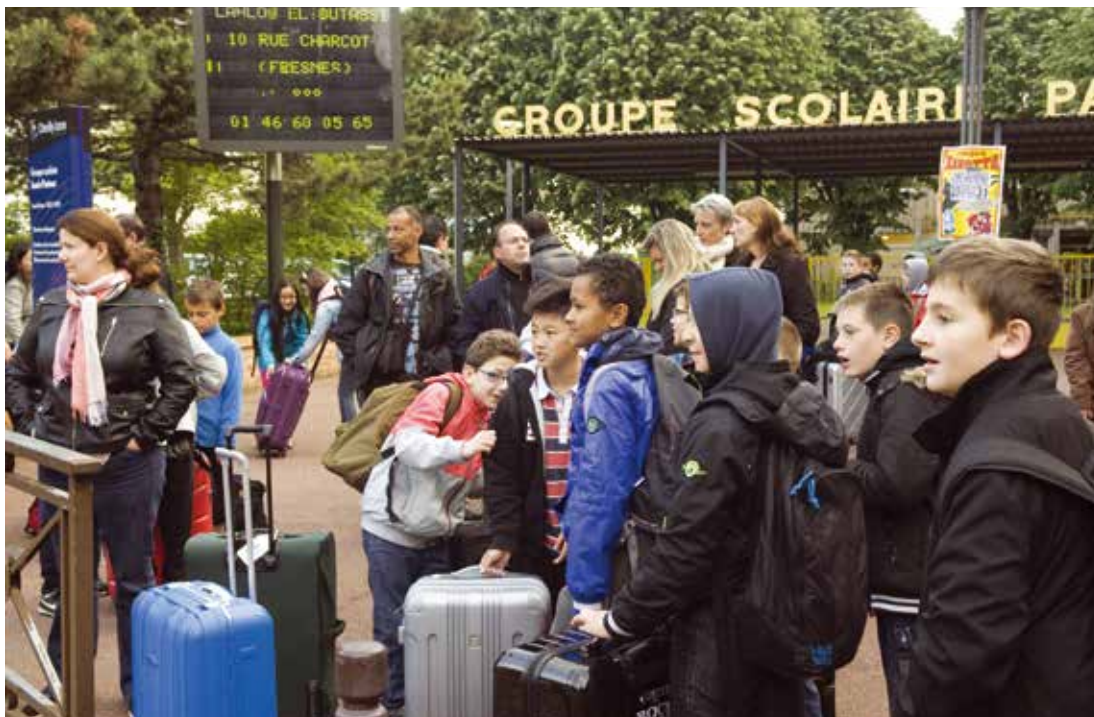
Les élèves de l'école Pasteur prêts pour le départ vers Saint-Hilaire de Riez en Vendée, le 22 mai dernier

H heureux les 238 élèves d'élémentaires de toutes les classes de CM2 qui ont profité cette année d'une classe d'environnement. En janvier, deux classes de l'école Paul Bert ont ainsi connu les joies des classes de neige à Méaudres, dans l'Isère. En mars, trois classes de l'école Pierre et Marie Curie sont parties à La Bourboule pour un séjour géologie. Deux classes de l'école Pasteur ont pris la