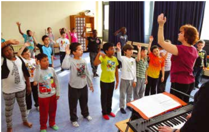
Dans le cadre du PEL, les classes artistiques (musique, danse, conte) menées avec le conservatoire ou la Maison du Conte se sont développées dans toutes les écoles élémentaires de la ville.