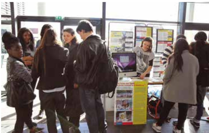
Les rendez-vous de la jeunesse, initiés cette année par le service municipal de la Jeunesse au lycée Pauline Roland et à la Maison pour tous, contribuent à impliquer les jeunes dans la mise en place de projets.