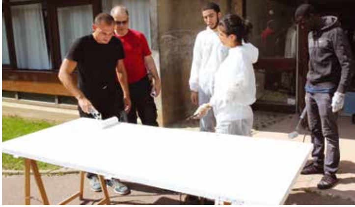
L'insertion professionnelle des jeunes est un des axes du PEL. Les chantiers d'été organisés par le service municipal de la Jeunesse y contribuent.