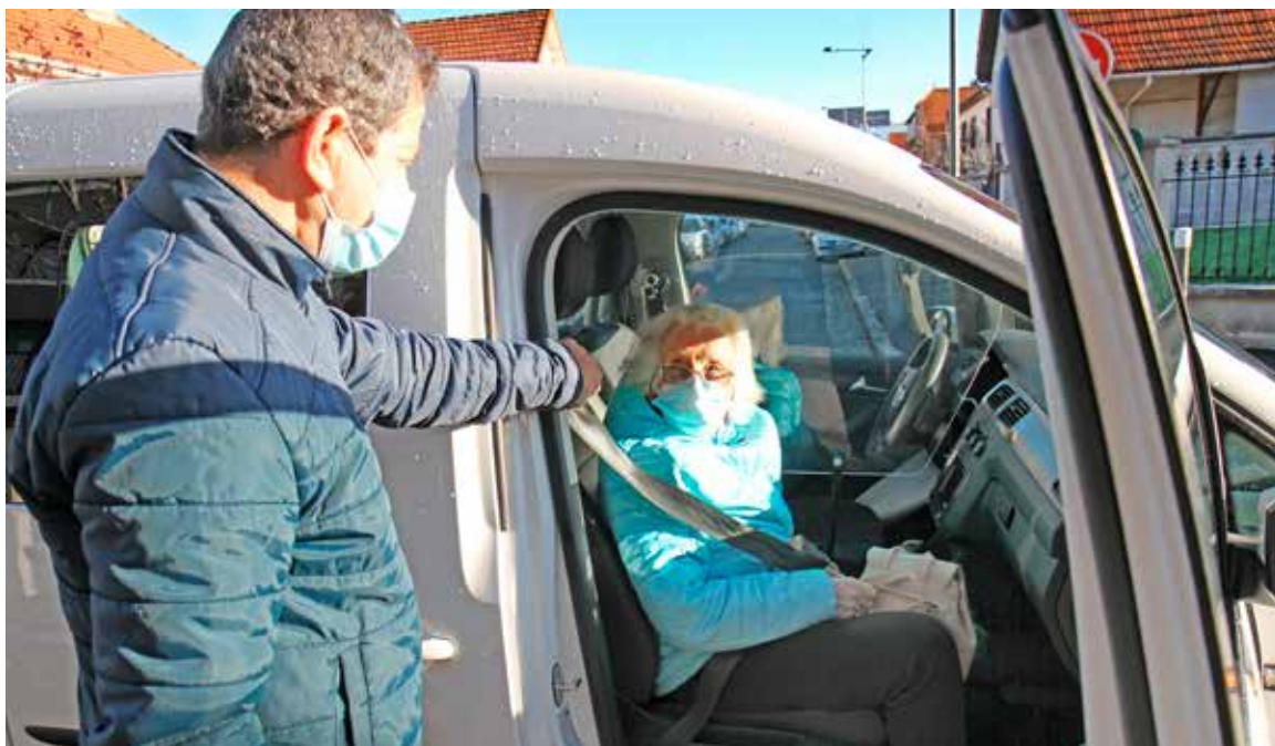
Pendant le confinement, les services municipaux répondent aux besoins des habitants. Le service de transport à la demande est ainsi maintenu : l'intérieur du véhicule est nettoyé avant chaque course et un plexiglas a été apposé entre la place du chauffeur et celle du passager.

R EPAS LIVRÉS aux personnes âgées et/ou isolées, maintien de l'aide à domicile et du transport à la demande, mise en place des protocoles sanitaires dans les écoles, élaboration d'une aide financière à de nombreux Chevillais, ... Dès le premier confinement, le 16 mars, les services municipaux ont tout mis en œuvre pour assurer la bonne tenue des services à la population et répondre aux besoins des habitants. Avec le deuxième confinement, le 29 octobre, ils ont mis à profit les enseignements du premier épisode pour transformer en savoir-faire la réactivité imposée par l'urgence et faire preuve d'adaptabilité face à la crise sanitaire de la Covid-19.