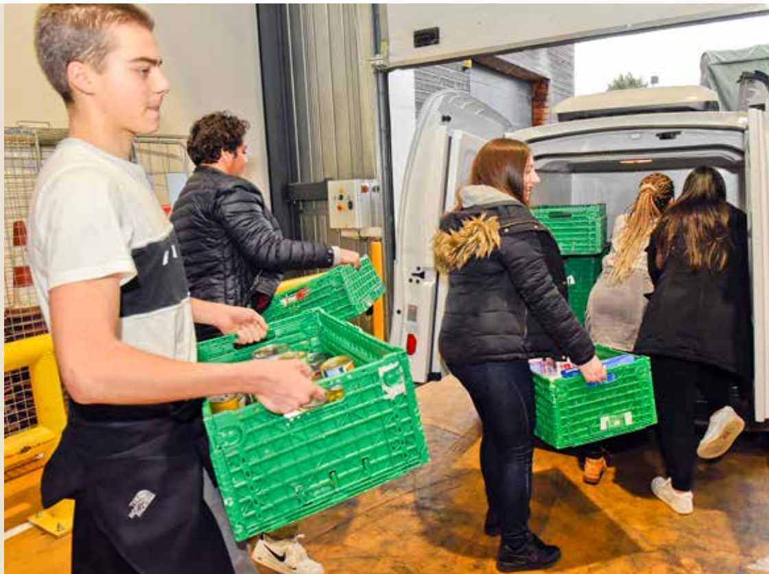
Comme l'année dernière (notre photo), les lycéens de Pauline Roland organisent en ce moment la collecte solidaire au profit de Sol'Épi et du Secours populaire.

Cette année encore les jeunes Chevillais organisent la grande collecte solidaire au bénéfice du Secours populaire et de l'épicerie solidaire Sol'Épi. Pilotée par le service Jeunesse, elle rassemble habituellement l'ensemble des élèves des écoles élémentaires, des collèges et du lycée. En cette année particulière, seuls les lycéens organisent la collecte. Elle se tiendra jusqu'au 17 décembre, date prévue de la pesée avant la remise des denrées aux deux associations. Cette initiative apparaît plus que jamais essentielle alors que les demandes d'aide alimentaire adressées à Sol'Épi et au Secours populaire augmentent de mois en mois. ✨