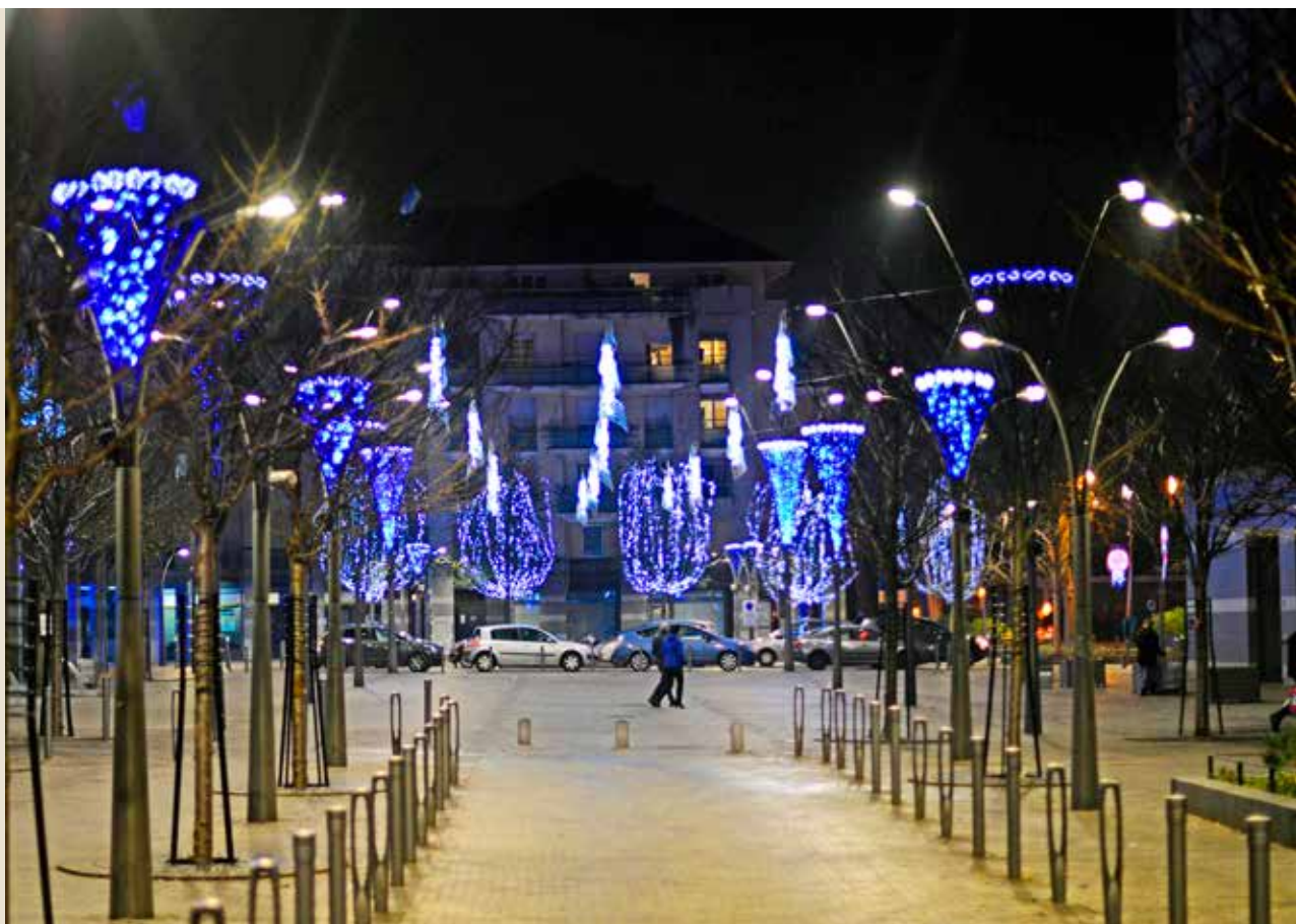
Les quartiers de la ville se vêtent de leurs habits de fêtes, à l'image de la place Mandela qui s'illumine.

Que serait Noël sans les sapins, les guirlandes scintillantes et les décorations qui ornent les vitrines des boutiques et s'invitent dans les foyers ? Comme chaque année, la magie des fêtes brille sur toute la ville grâce aux décors qui se déploient dans les quartiers. Avec le plafonnier lumineux qui surplombe la place Mandela, le voile qui s'étend sur le pont de l'A6, les traversées d'entrée de Joyeuses fêtes à tous, les décorations aux abords de l'église ou le sapin géant qui trône sur le rond-point Mermoz, les enfants et les plus grands ont de quoi s'émerveiller. ✨