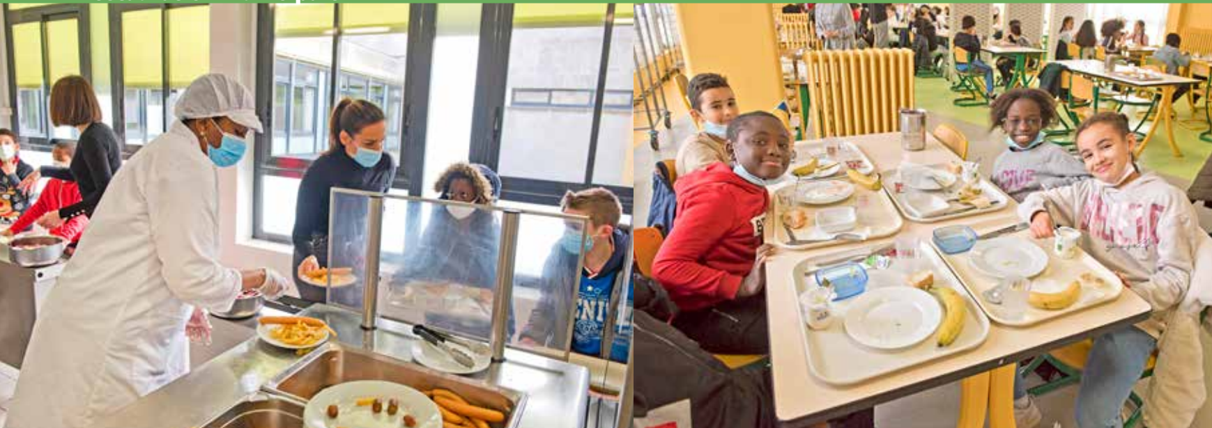
Plexiglas entre la zone alimentaire et les enfants, personnel supplémentaire qui compose les plateaux, prise des repas par petits groupes, ... La restauration dans les écoles répond à un protocole sanitaire très strict.

Le reconfinement a occasionné un temps de travail supplémentaire pour les équipes de la restauration scolaire et pour celles des portages de repas à domicile. Ces services se sont réorganisés pour répondre efficacement aux exigences des nouveaux protocoles sanitaires.