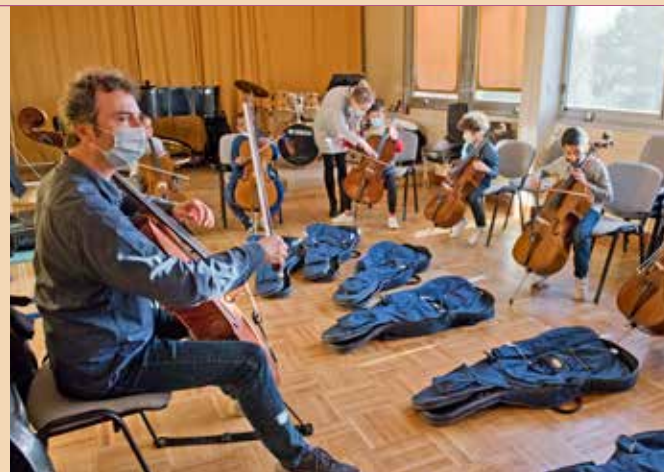
La classe musicale de l'école élémentaire Paul Bert B.

mis en place pour accueillir des élèves en situation de handicap. Pendant ce deuxième confinement, ces activités se poursuivent dans les établissements lorsqu'ils disposent d'une salle musicale dédiée, sinon au sein du conservatoire, les enseignants ayant finalement reçu l'autorisation de se déplacer vers la structure, malgré un plan Vigipirate également renforcé. * C. C