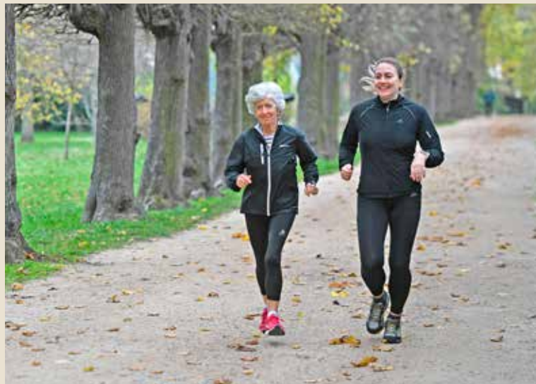
Le jogging, un sport accessible à tous.