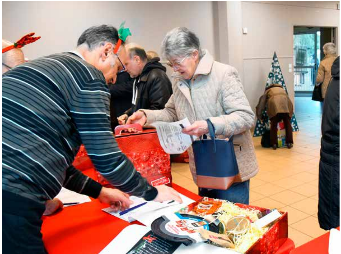
La distribution des colis aux aînés se tiendra du 7 au 10 décembre afin d'éviter des rassemblements trop importants.

La traditionnelle distribution des colis de Noël aux aînés est bien entendu maintenue mais son organisation est quelque peu modifiée afin d'éviter des rassemblements trop importants. Celle-ci se déroulera donc du lundi 7 décembre en début d'après-midi au jeudi 10 décembre à midi à la salle Simone de Beauvoir. Le service Retraités-Santé-Handicap, pilote de cette initiative, a déjà invité les bénéficiaires à venir récupérer leur colis à un moment précis. Les personnes qui ne pourront pas se déplacer peuvent faire appel à un tiers pour le retirer. Les aides à domicile et les agents du portage des repas peuvent aussi apporter les colis au domicile des personnes chez lesquelles ils interviennent. Des centaines de Chevillais reçoivent chaque année ce panier gourmand qui comporte tout ce qu'il faut pour profiter d'un vrai repas de fête : foie gras, chocolat, bouteille de vin, etc. Toutes les autres initiatives du service pour les fêtes sont annulées, notamment le grand repas de Noël qui rassemble habituellement les retraités au foyer Gabriel Chauvet. Celui-ci est encore fermé au moment où nous écrivons ces lignes.