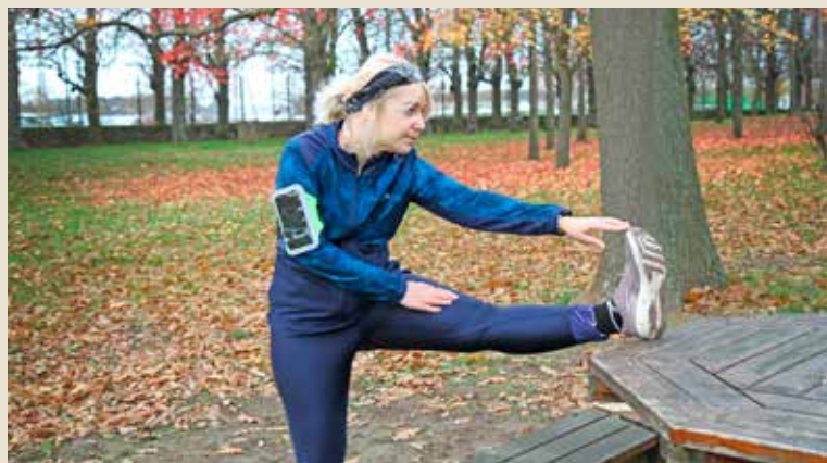
Ne pas oublier de bien s'étirer après une séance de sport, pour éviter les blessures.

ENTRE LES SÉANCES de renforcement musculaire à la maison et les joggings à proximité de chez soi, des millions de Français ont profité du confinement pour faire du sport. Une augmentation accrue de l'activité physique qui n'a pas été sans conséquence pour les sportifs amateurs. Déchirures musculaires, entorses, fractures de fatigue, de nombreuses blessures sont venues freiner leur progression et encombrer les cabinets médicaux. Si la pratique du sport est essentielle pour notre santé, elle doit s'accompagner