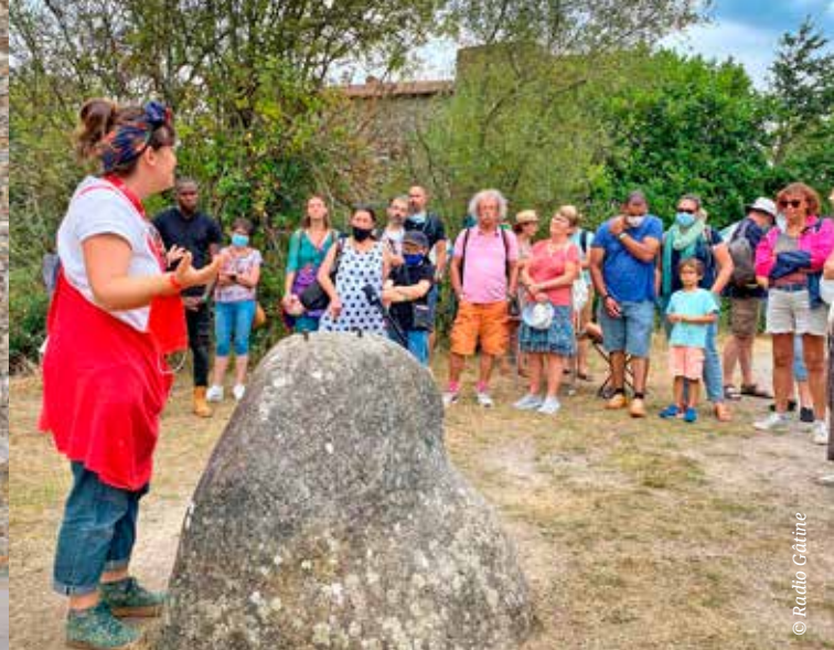
Malgré la pandémie, le festival de conte Le Nombriil du monde organisé à Pougne-Hérissou, a pu célébrer son 30 e anniversaire ; il a été un des rares événements culturels à pouvoir se tenir cet été.