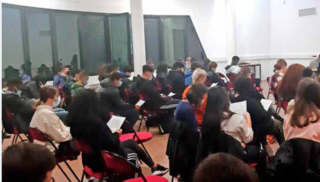
L'hommage à Samuel Paty au lycée Pauline Roland.

Sachant bien lire, l'écolier, qui est très curieux, aurait bien vite, avec sept ou huit livres choisis, une idée, très générale, il est vrai, mais très haute de l'histoire de l'espèce humaine, de la structure du monde, de l'histoire propre de la terre dans le monde, du rôle propre de la France dans l'humanité. Le maître doit