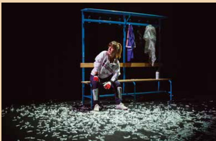
Le syndrome du banc de touche , symptôme de la frustration de celui qui aimerait entrer sur le terrain de jeu ...

Forme olympique exigée le 28 février au théâtre. Chassez vos crampons pour Le syndrome du banc de touche avant de vous préparer à piquer un Cent mètres papillon .