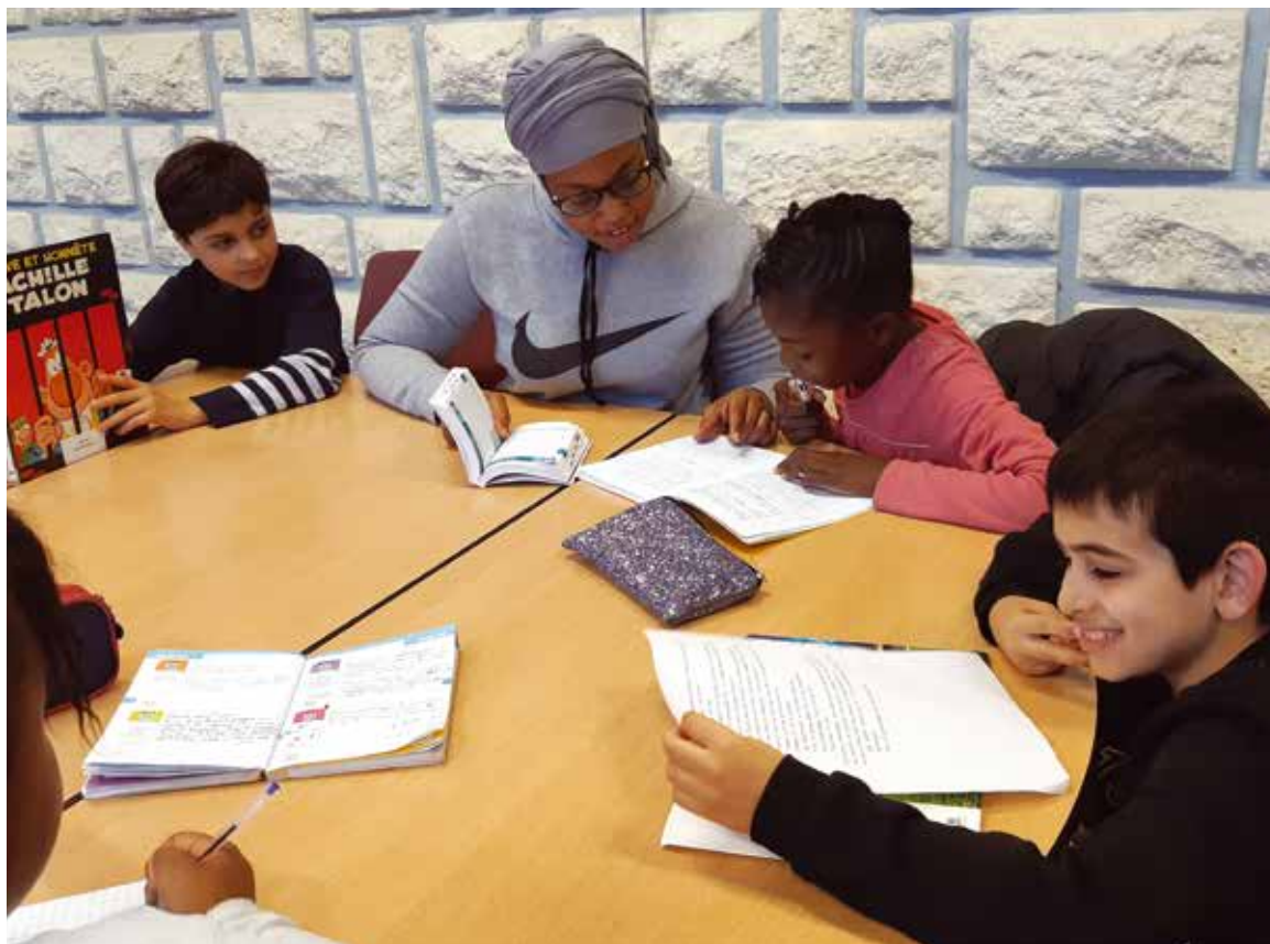
Une dizaine d'élèves de CM1 se rendent à la Maison pour tous quatre fois par semaine pour bénéficier du dispositif d'aide aux devoirs.

Une quarantaine de petits Chevillais, répartie par niveau, sont ainsi encadrés par des bénévoles et des vacataires qui les accompagnent dans leurs apprentissages et leur donnent les outils méthodologiques pour être mieux organisés. « Le CLAS permet aussi un éveil culturel grâce à de nombreux partenariats avec les équipements municipaux comme la Maison des arts plastiques, la médiathèque ou le conservatoire de musique » ajoute Fabien Marchand, coordinateur d'un dispositif qui « respecte le rythme d'apprentissage des enfants tout en favorisant leur créativité et leur épanouissement ».