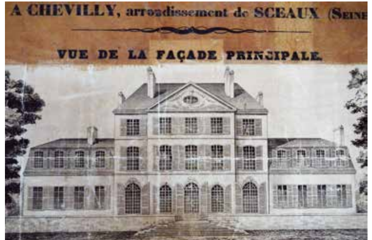
Extrait de l'affiche imprimée en vue de la vente du château de Chevilly par la veuve de Pierre François Outrequin le 15 septembre 1855.