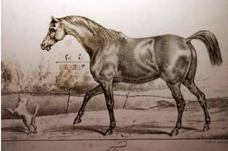
Gravure représentant Féragus parue dans le Journal des haras, chasses et courses de chevaux d'avril 1835.