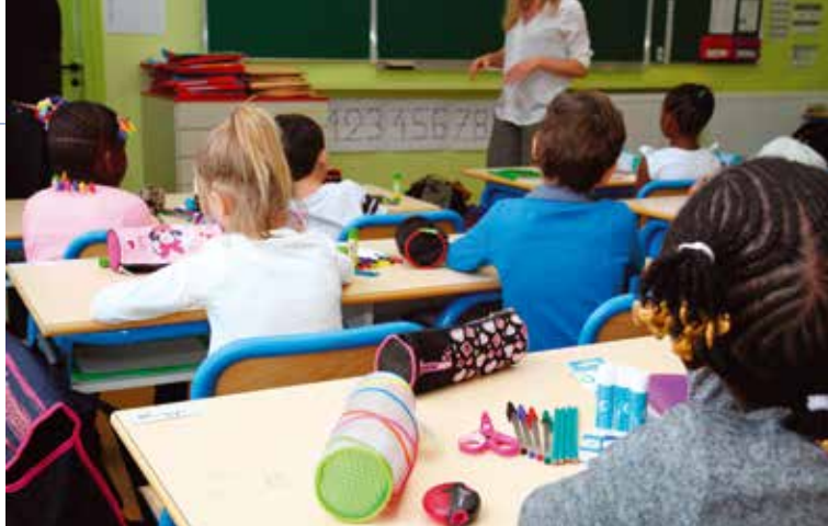
La future école dans la ZAC Anatole France répondra aux besoins des parents du secteur.

Le job truck du Comité de bassin d'emploi du Val-de-Marne (CBE 94) donne rendez-vous aux personnes en recherche d'emploi jeudi 6 février de 14h à 17h30 rue de Bretagne, au sein du quartier des Sorbiers. Ce bureau mobile offre aux demandeurs d'emploi un lieu pour découvrir l'association et ses actions d'accompagnement : découverte de métiers, atelier CV, préparation d'entretien, parrainage vers l'emploi... Autant de conseils et d'aides pour être plus efficace et soutenu dans sa recherche d'emploi.