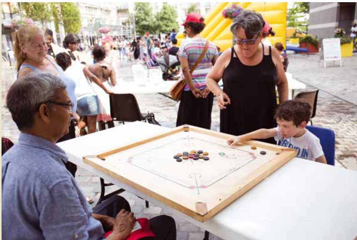
Manifestations festives et fédératrices, les Jeudis de l'été de la Maison pour tous ont notamment investi la place Nelson Mandela.

Pôle ressource pour les associations, la Maison pour tous a mis en place de nombreux partenariats au fil des ans, que ce soit avec les services municipaux, les équipements culturels, les établissements scolaires et l'ensemble des acteurs locaux. Elle a également développé des actions hors les murs pour se faire connaître du plus grand nombre. Chaque année la fête des centres sociaux, organisée avec la Ferme du Saut du Loup, autre partenaire de choix, et les Jeudis de l'été, animations festives et intergénérationnelles, rassemblent de nombreux Chevillais. ✱