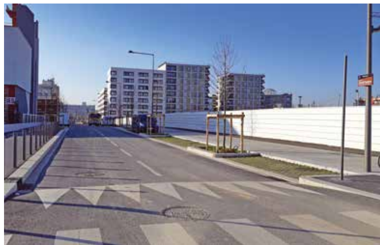
La rue de la Sécurité parisienne est en partie ouverte à la circulation.

Les travaux de voirie de la ZAC Triangle des Meuniers ont franchi une nouvelle étape : la rue de la Sécurité parisienne est ouverte partiellement.